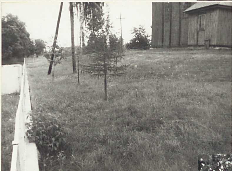
3. Cmentarz na pól od kościoła