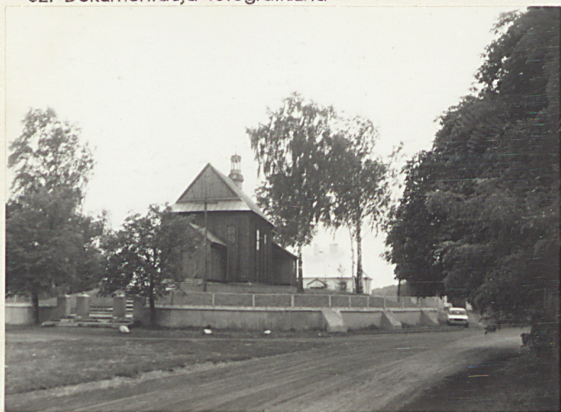
1. Złożenie kościoła od pschi