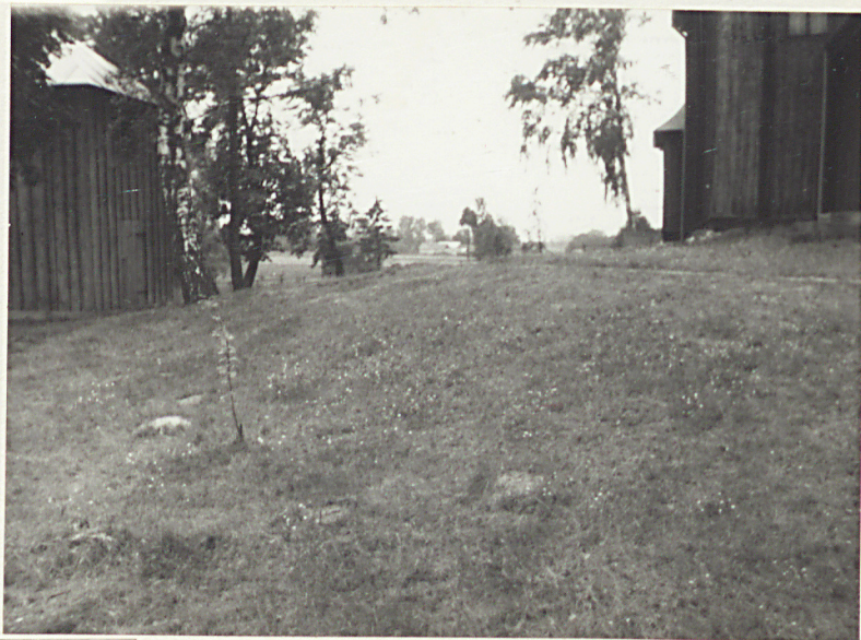
2. Cmentarz na pól od kościoła