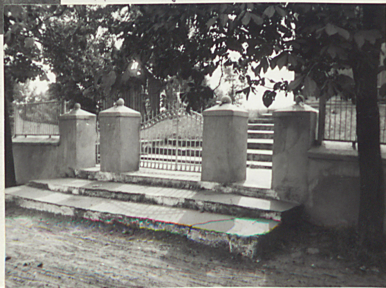
4. Brama grobowa