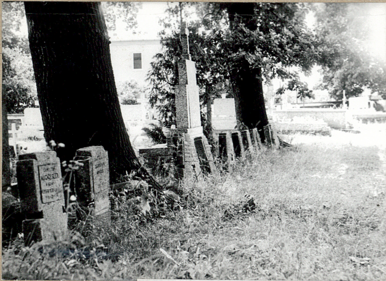
Kwaterna wojenna z 1914 r.