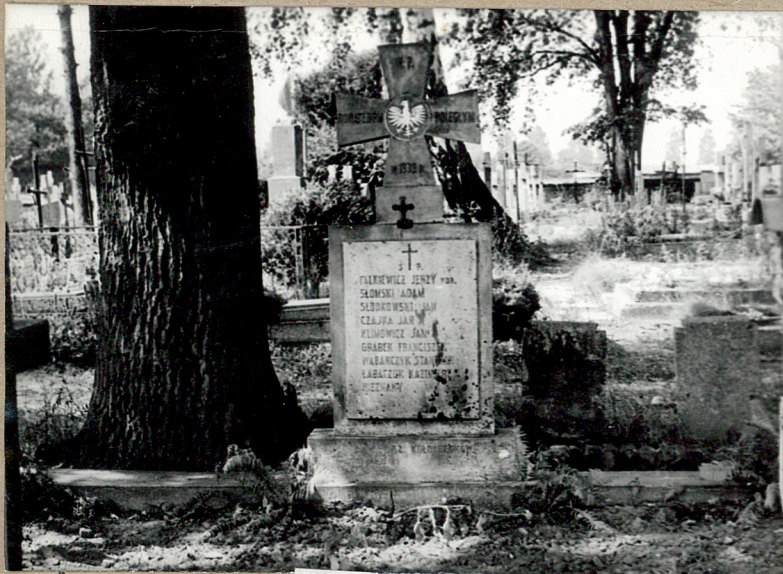
Kwaterna wojenna z 1939 r.