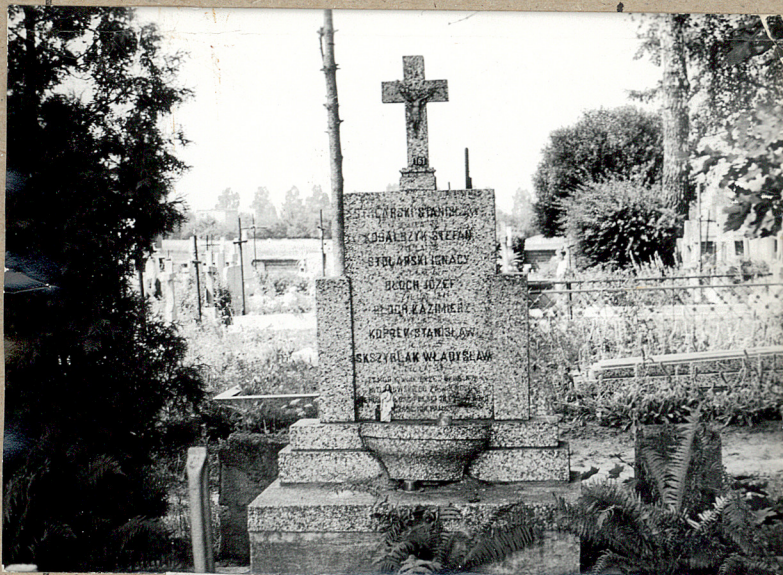
Kwaterna ofiar terroru z 1944 r.