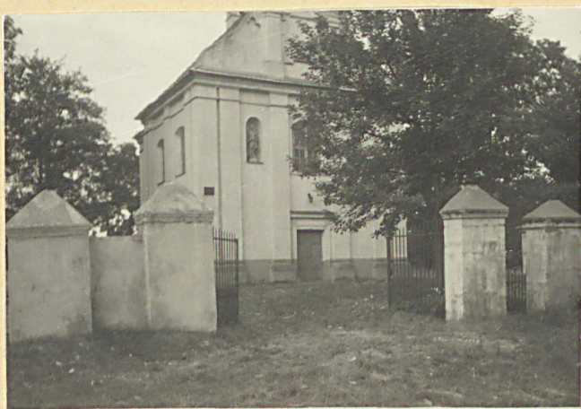
kościół św. Józefa