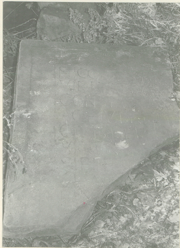
10. Фрагм. плиты из инсургей из ж.з. Тацискием.