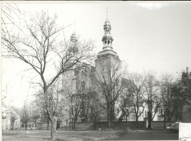
1. Widok od rzeki