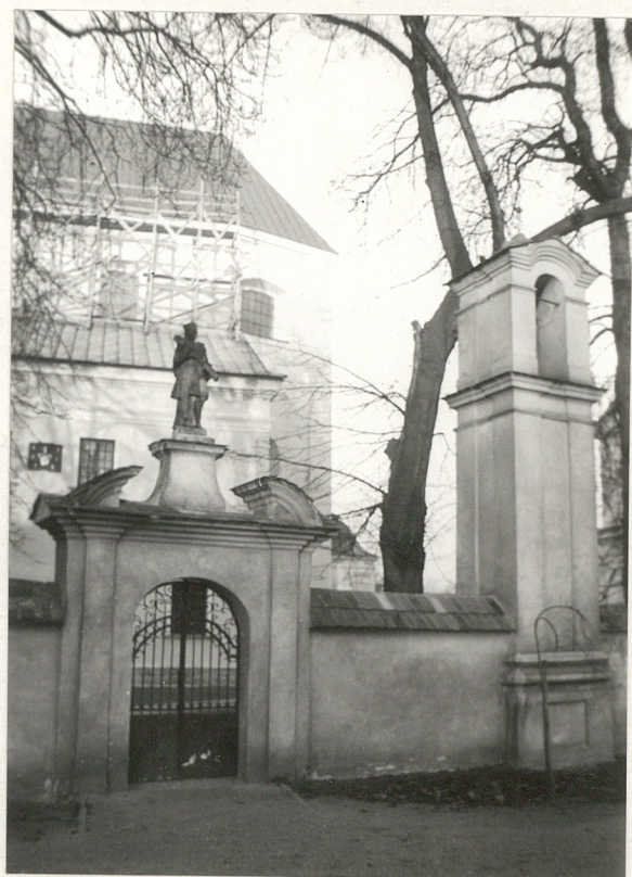
5. Furta od piot