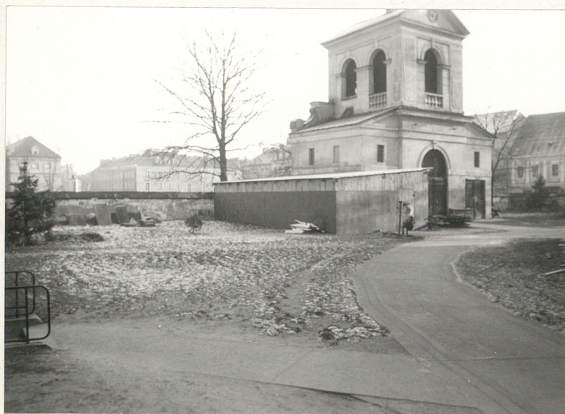
4. Teren na rzeki od kościoła, dronowice