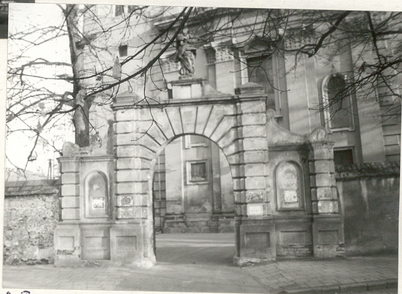
2. Bramy zamek.