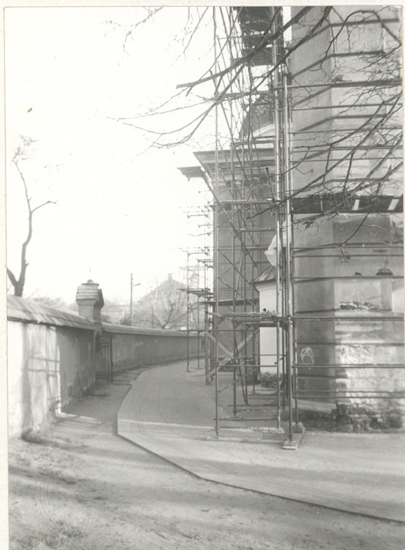
3. Teren na plan od kościoła