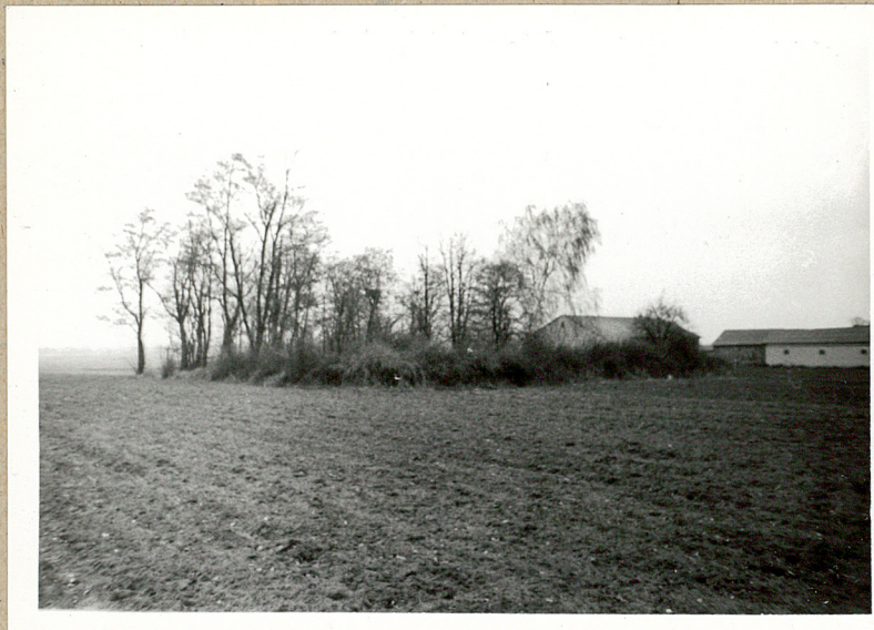
1. Widok cmentarza od pól, od strony drogi