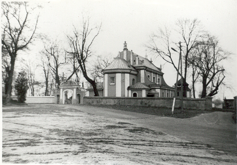
1. Widok od północy