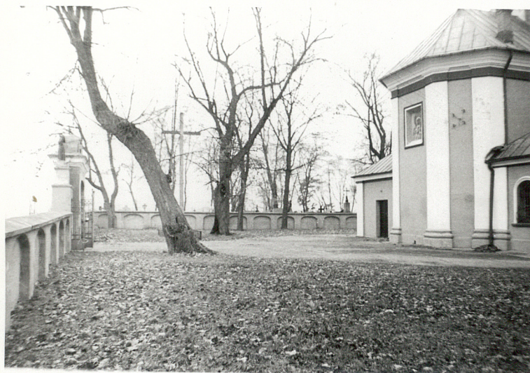
2. Teren na północy od kościoła