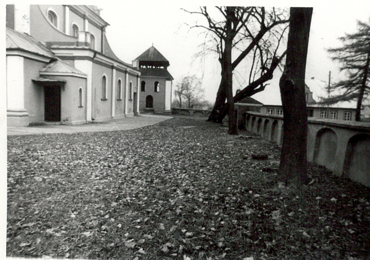
3. Teren na wschodzie od kościoła