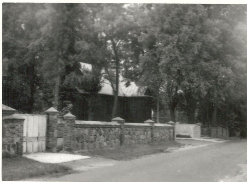
XVIII w Kościół