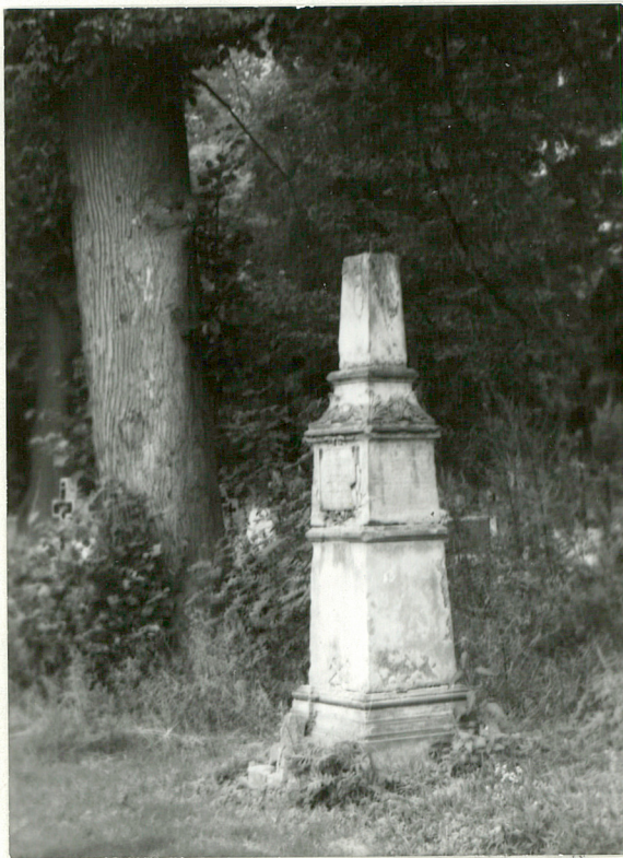
1879 GROB DOBIECKICH