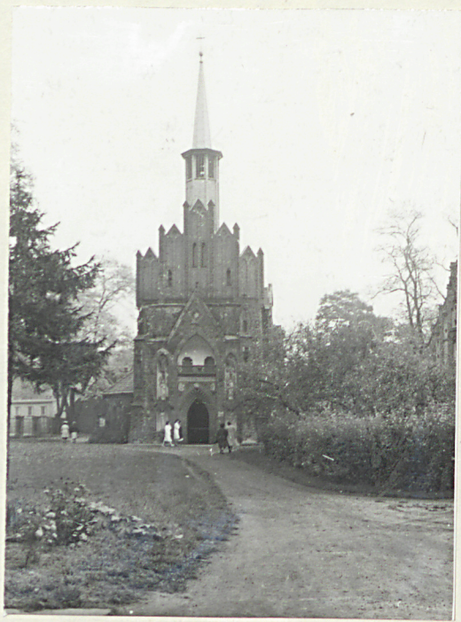
1. Widok ogólny z kościołem