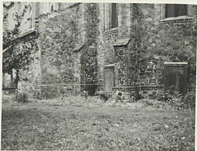
2. Frag. elewacji z płytą upamiętniającą