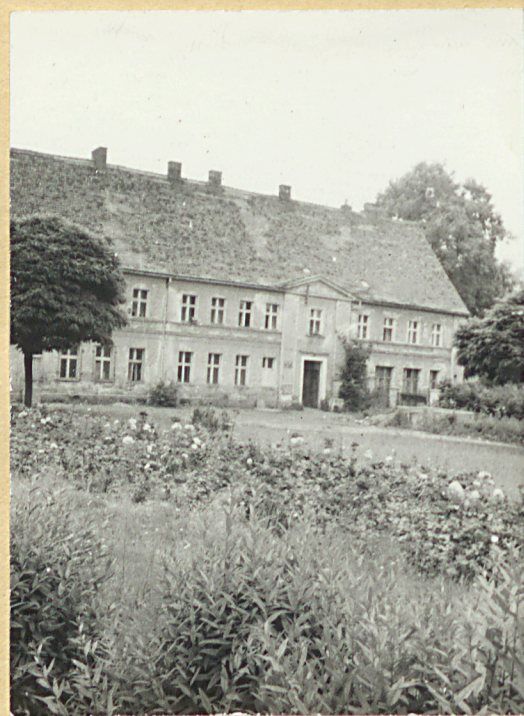
4. Oficyna na obrzeżu b.cmentarza