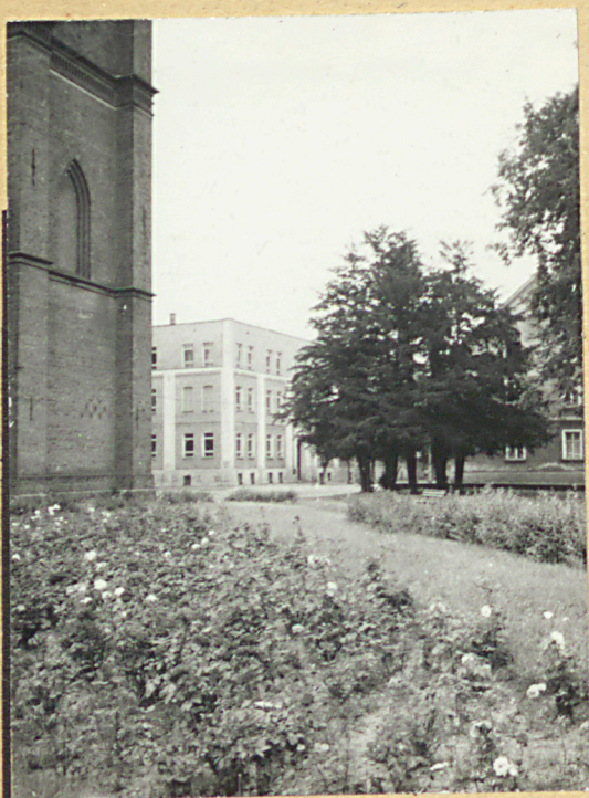
3. Teren b.cmentarza / obecnie skwer /