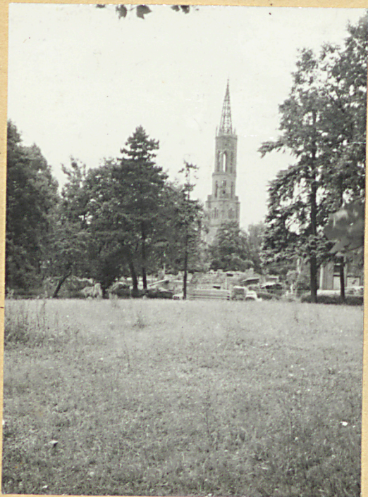
1. Widok ogólny z wieżą kościoła