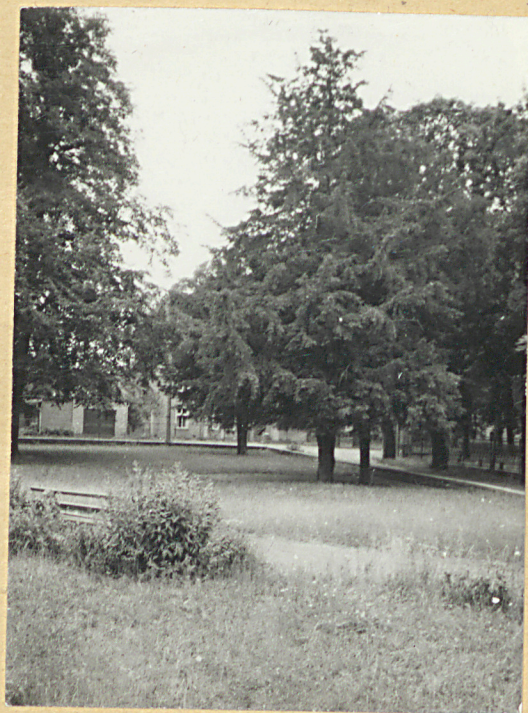
2. Fragment b.cmentarza