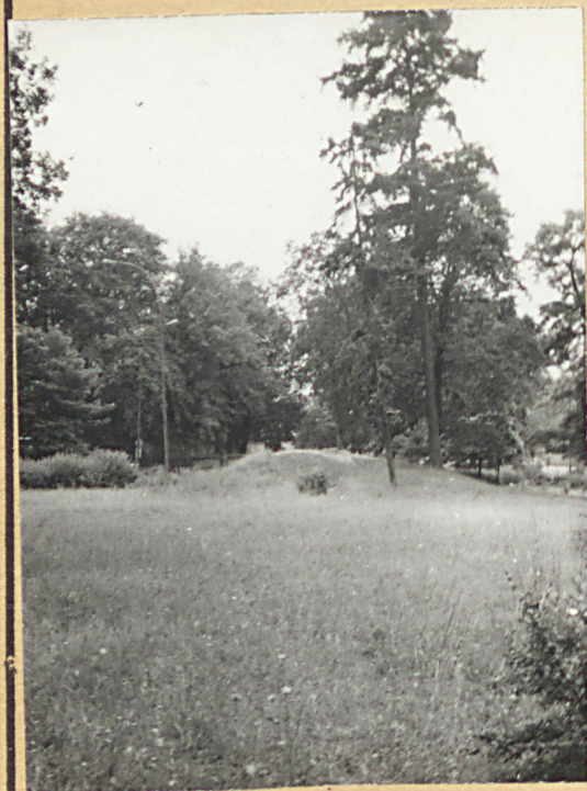
3. Teren pocmentarny przy kościele