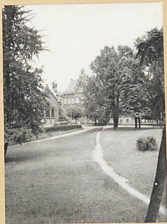
2. Teren pocmentarny przy kościele