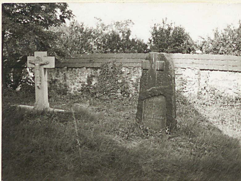
3. Nagrobki ewangelickie