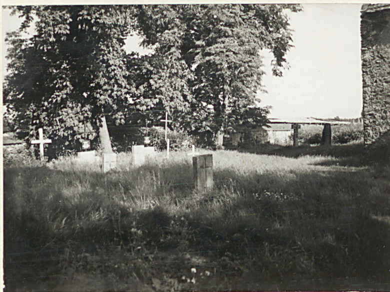
2. Widok ogólny terenu cmentarza