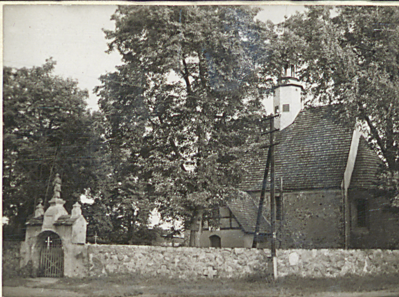
1. Widok ogólny na teren cmentarza i kościół