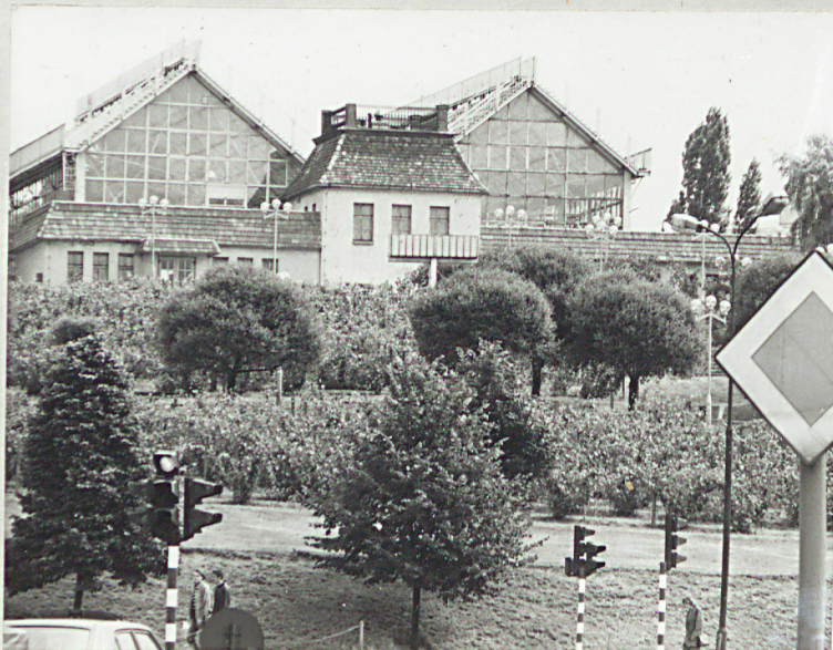
4. Fragment obecnego wzgórza Winnego