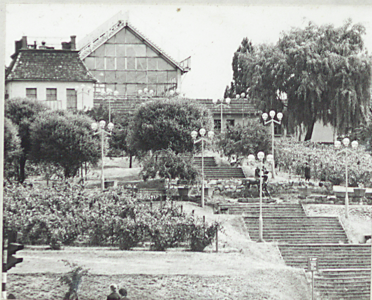
5. Fragment obecnego wzgórza Winnego