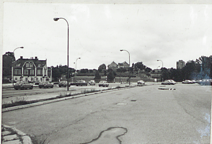
3. Widok ogólny obecnego wzgórza Winnego