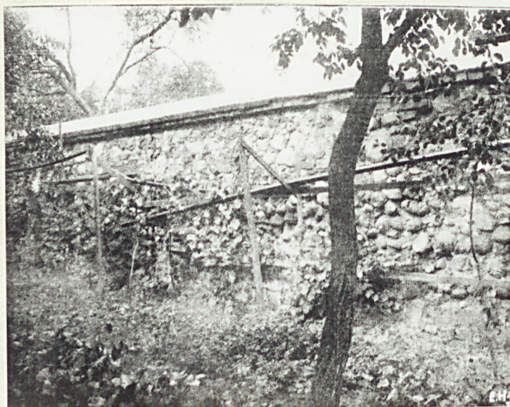
2. Fragment zniszczonego muru cmentarnego