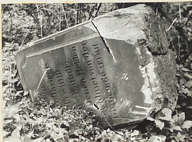
1. Fragment pomníka