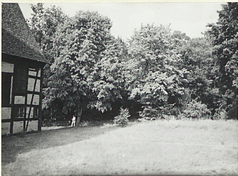
2. Widok ogólny na teren cmentarza w kierunku wschodnim