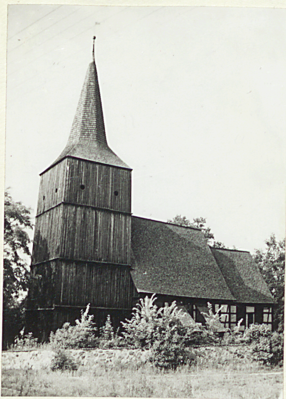
1. Widok ogólny na kościół i mur otaczający cmentarz przykościelny