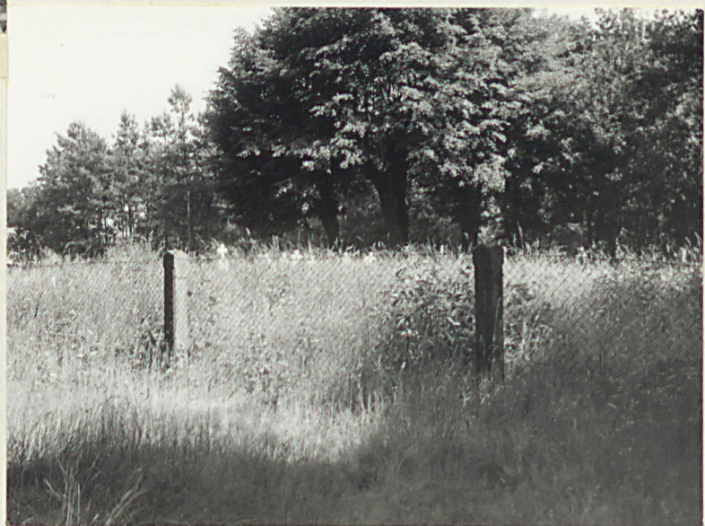
4. Widok ogólny