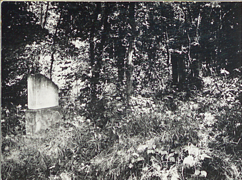
1. Nagrobki ewangelickie