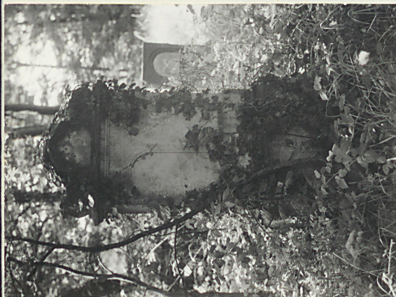
3. Nagrobek ewangelicki