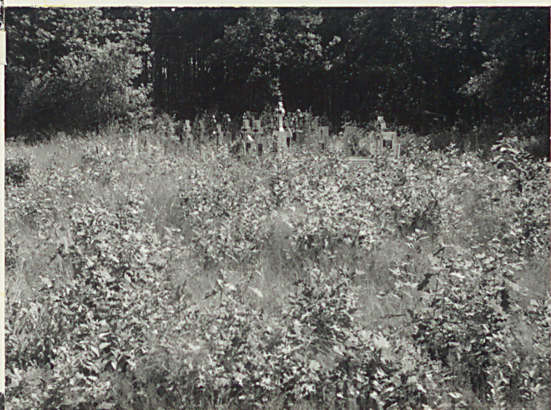
2. Nagrobki rzymsko-katolickie