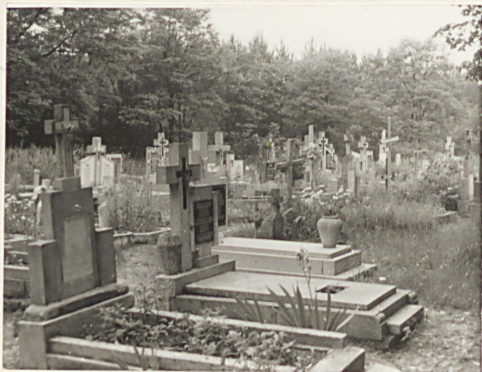
3. Widok części użytkowanej