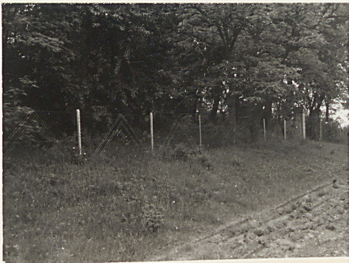
1. Widok od strony drogi