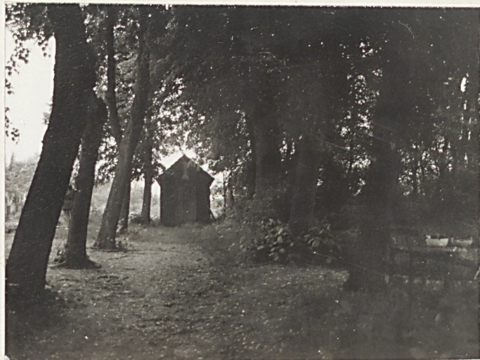
2. Widok na kaplicę