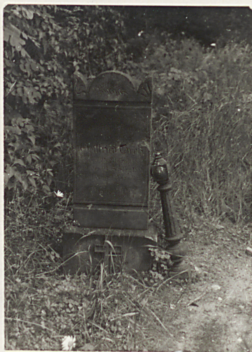
4. Nagrobek ewangelicki