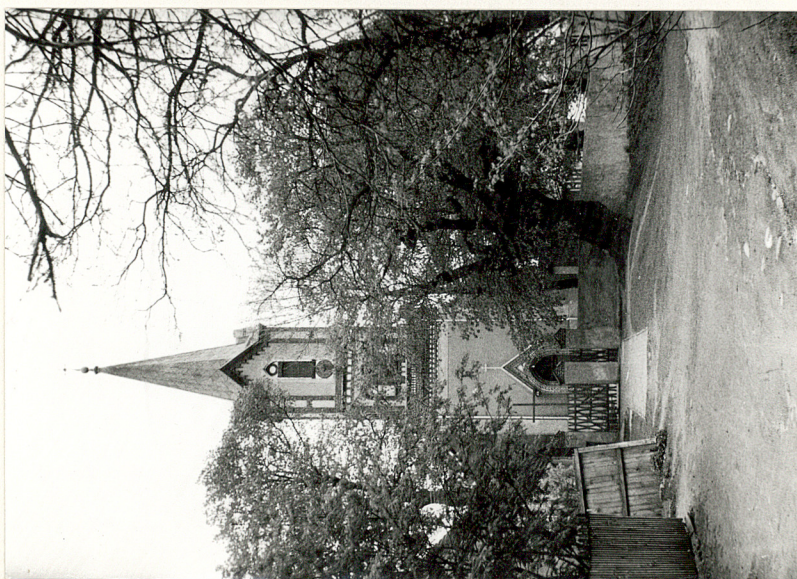
3. Widok ogólny