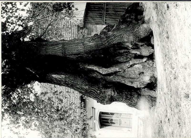
1. Lipa po zewnętrznej stronie muru