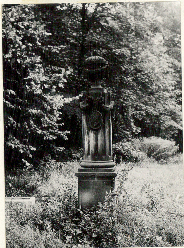
4. Pomnik: Alexander Friedrich von Seydlitz /zm. 1793 r./