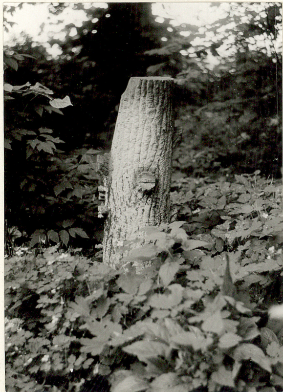
3. Fragment nagrobka ewangelickiego