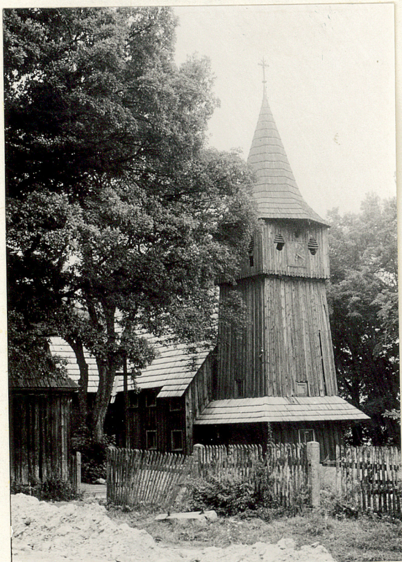
1. Widok ogólny