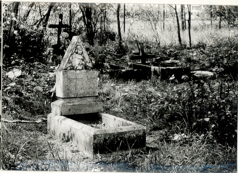
1. Nagrobki katolickie, adaptowane z ewangelickich