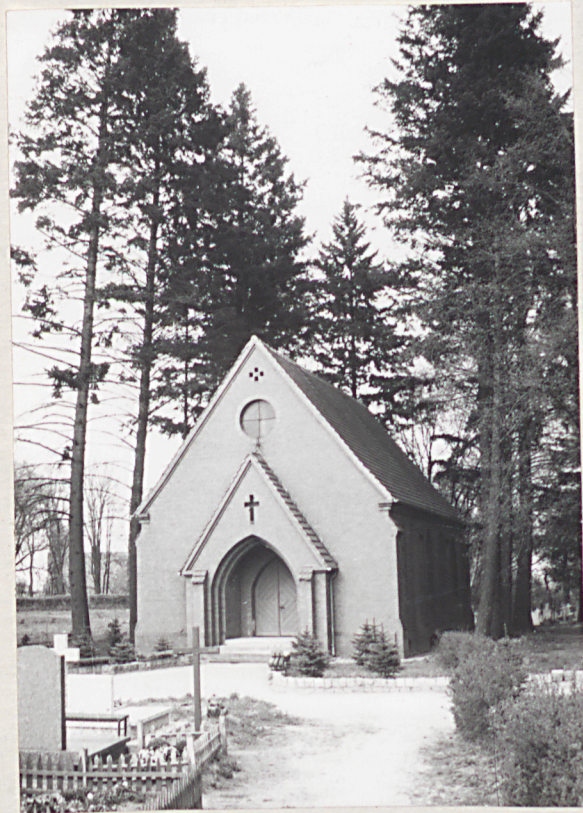
Dobiegniew, cm. komunalny 1. Widok ogólny od strony cm. zlikwidowanego 2. Kaplica cmentarna