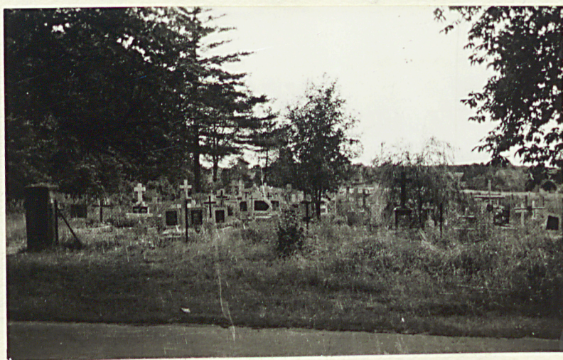
1. Widok ogólny terenu cmentarza w kierunku północnym

Najpowszechniejszy typ nagrobka - postument z krzyżem.