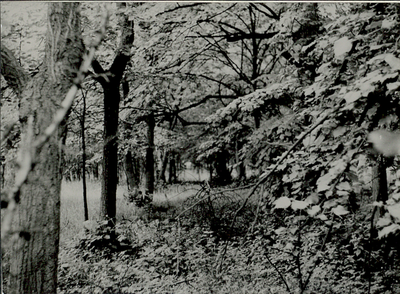
1. Aleja lipowa