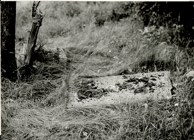
2. Fragment nagrobka ewangelickiego