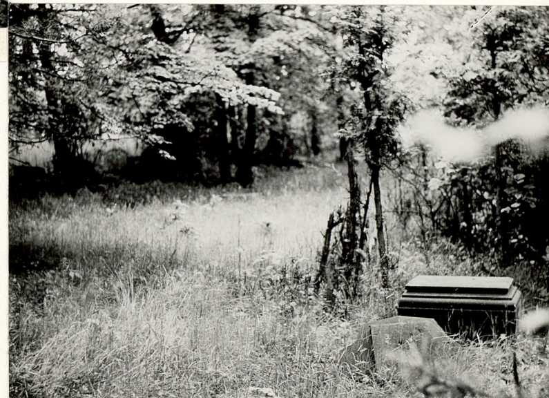
4. Widok ogólny