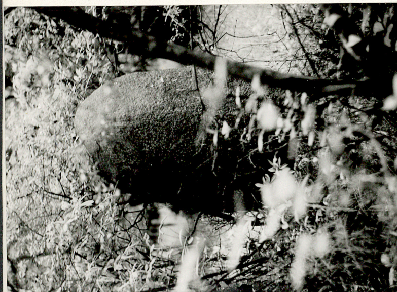
3. Nagrobek ewangelicki