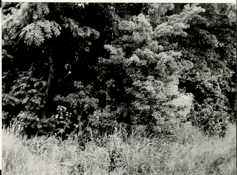
2. Mur i kraty wyznaczające kwaterę