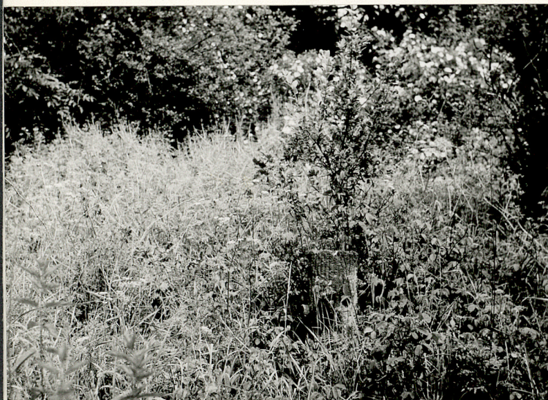
3. Fragment mogrobka ewangelickiego