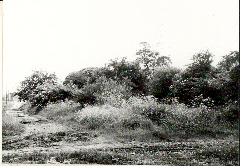
4. Widok ogólny