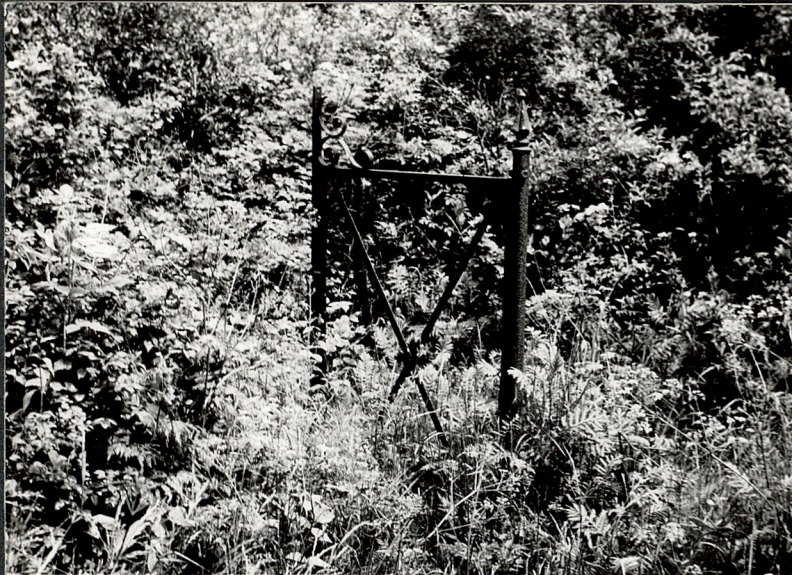
1. Pozostałości opłotowania