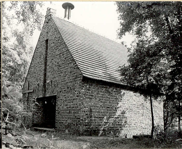
Fot.7. Kaplica cmentarna obecnie cerkiewka grecko-katol.