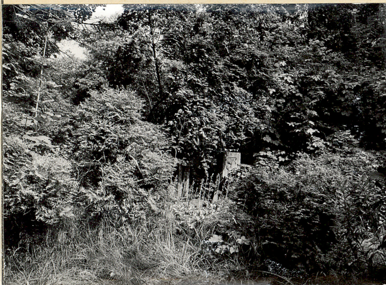
Fot.6. Kwaterna grobów poniemieckich w środkowej części cmentarza