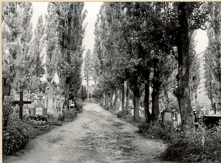
Fot.5. Aleja topolowa w płn.-wach.części cmentarza