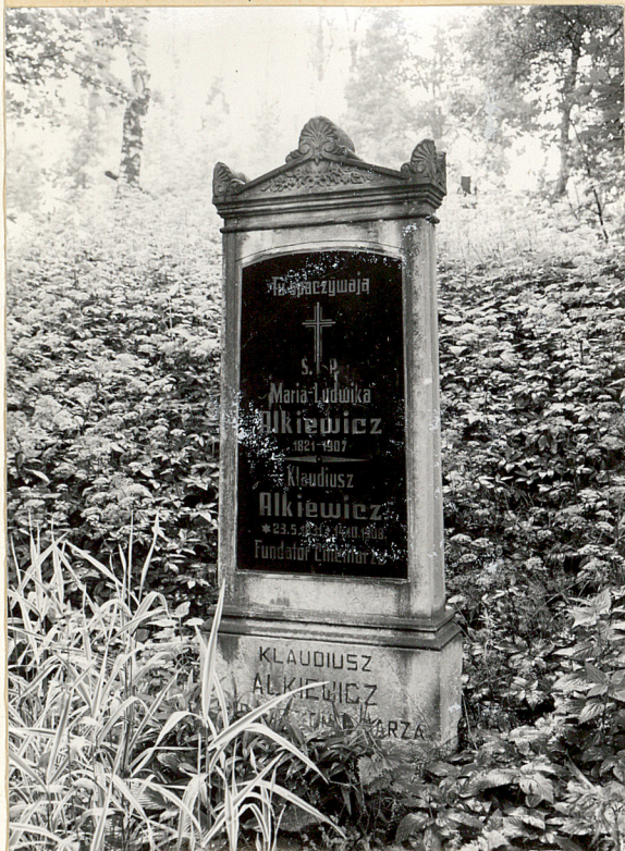
Fot.4. Nagrobek klasycystyczny fundatora cmentarza