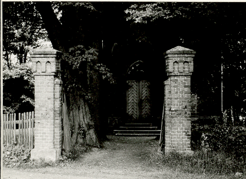
3. Lipy przy bramie wejściowej do kościoła