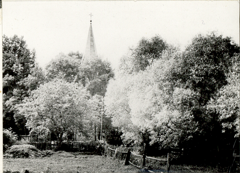
4. Widok ogólny