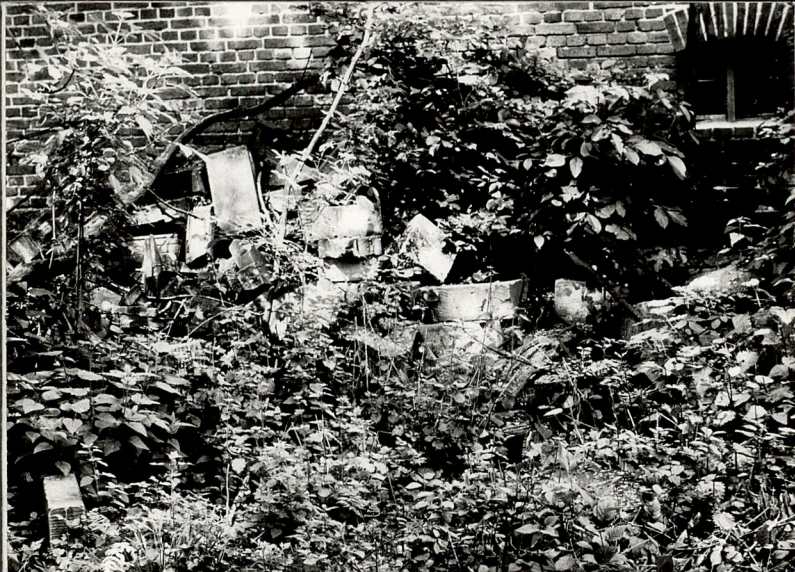
1. Rumowisko nagrobków ewangelickich