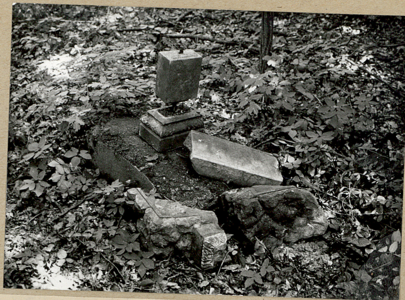
2. Fragmenty nagrobków w części pd.