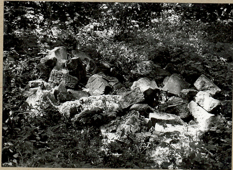
3. Czerwisko nagrobków w części pn.