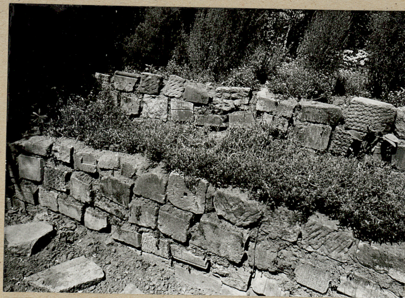
4. Skarpy wyłożone płytami nagrobnymi na prywatnej posesji właściciela