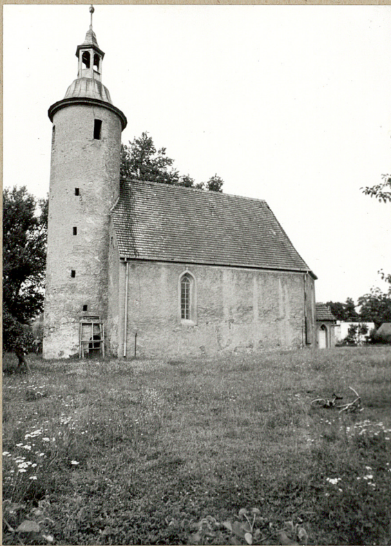
1. Widok ogólny od strony pd-zach.