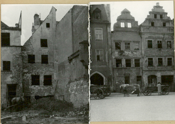
Zjednoczenie - zam. 1856, 18. 11. 57 - 12000 - kart.