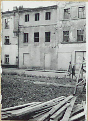
Zjednoczenie - Zam. 1058, 10. 11. 57 - 12000 - kart.