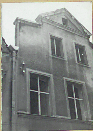
Zjednoczenie - zam. 1858, 18. 11. 57 - 12000 - kart.