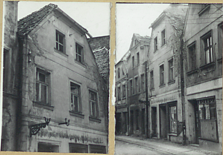
Zjednoczenie – sam. 1858, 18. 11. 57 – 12000 – kart.