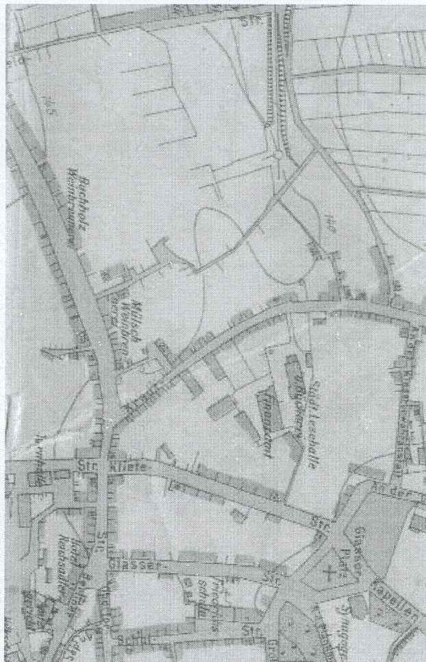
Fragment planu Zielonej Góry z 1926 roku