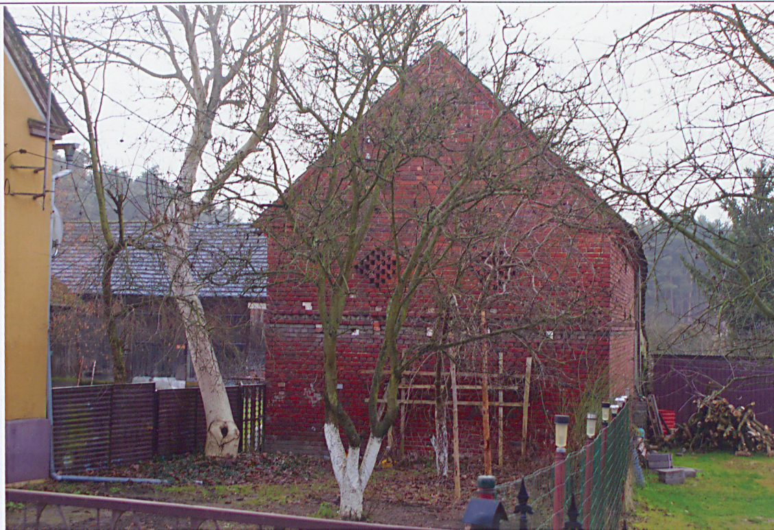
Widok od strony wschodniej