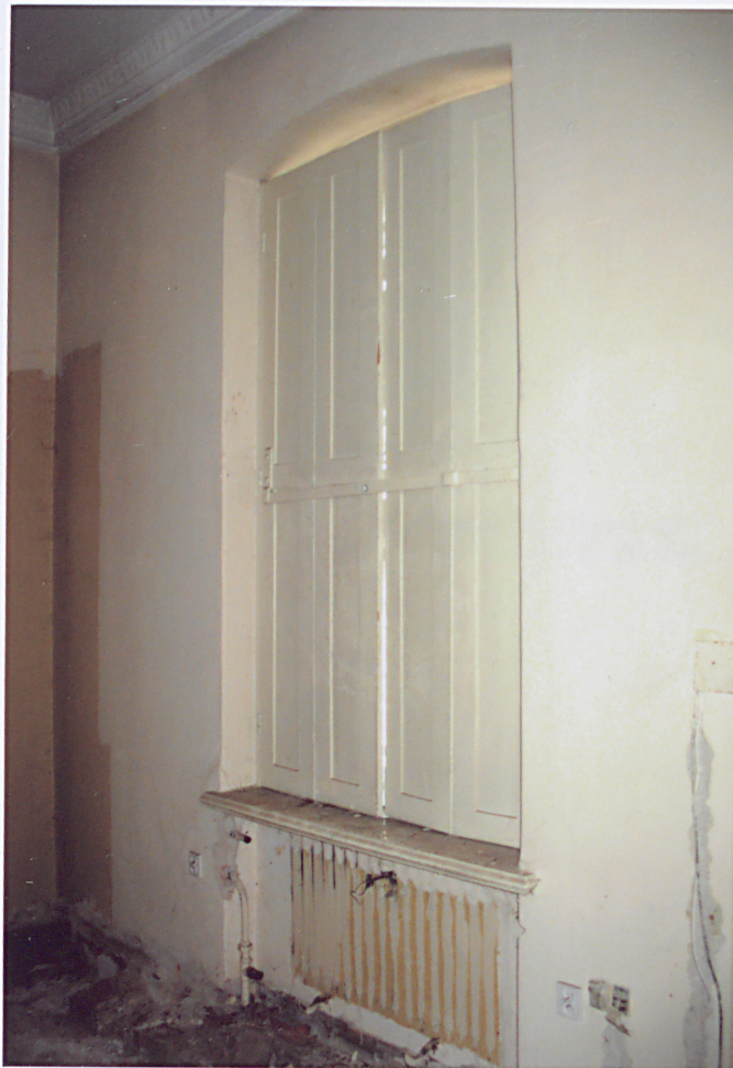
11. Okiennice wewnętrzne na parterze.