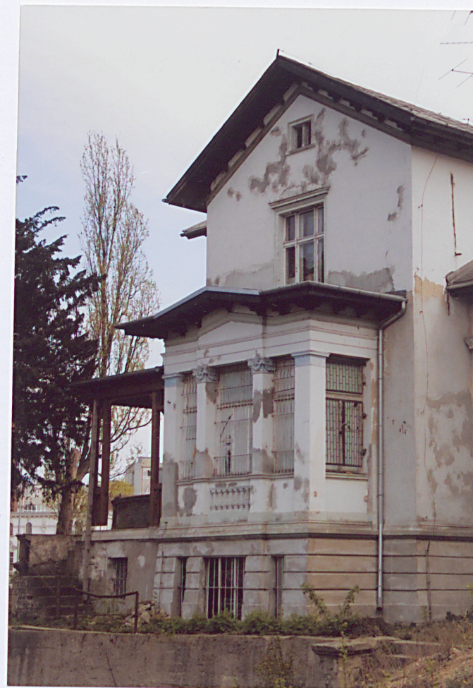
8. Ganek przy skrzydle północno – zachodnim.