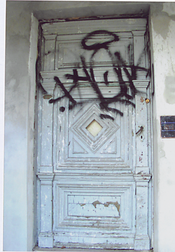
10. Drzwi główne.