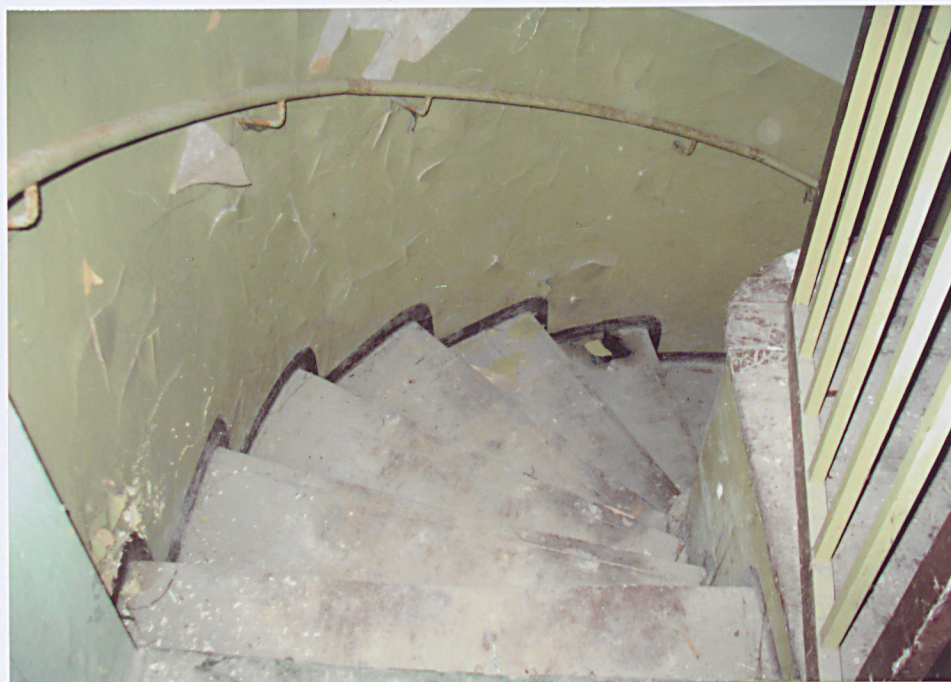
15. Schody do piwnicy.