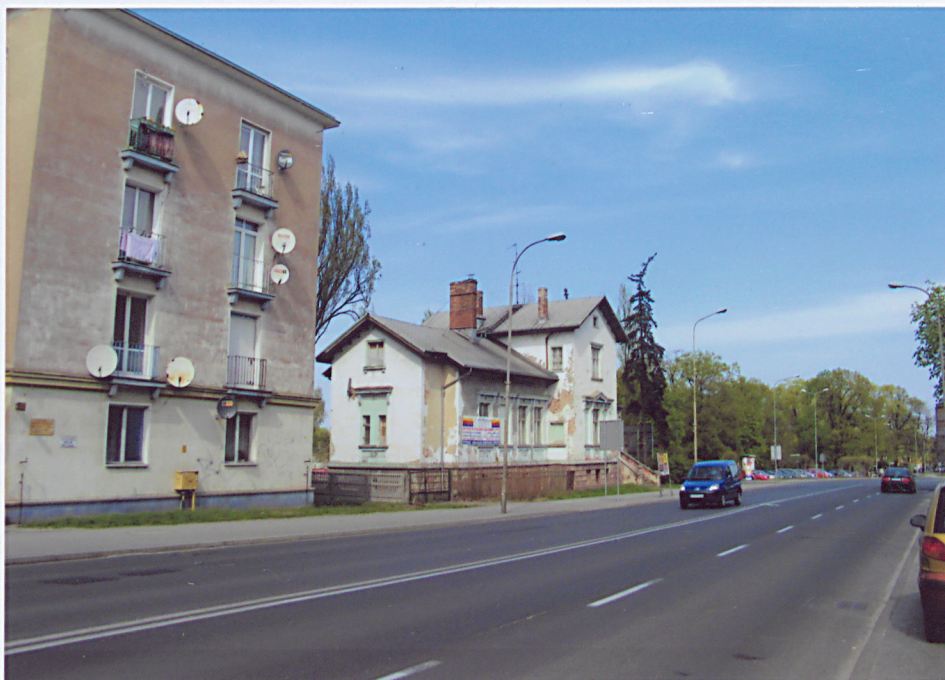
1. Widok od południowego zachodu.