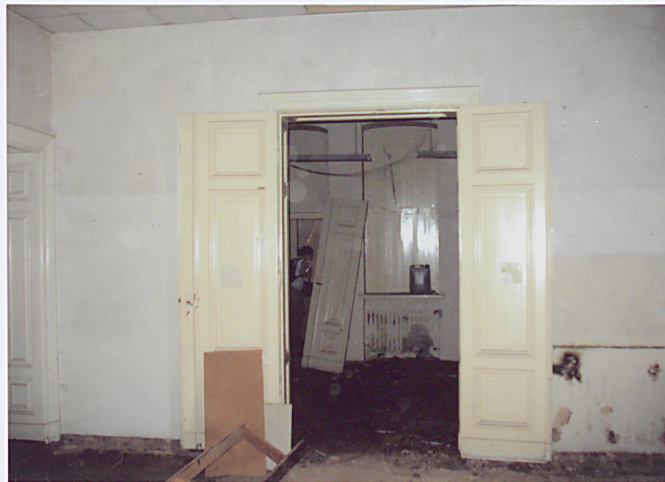
12. Drzwi wewnętrzne na parterze.