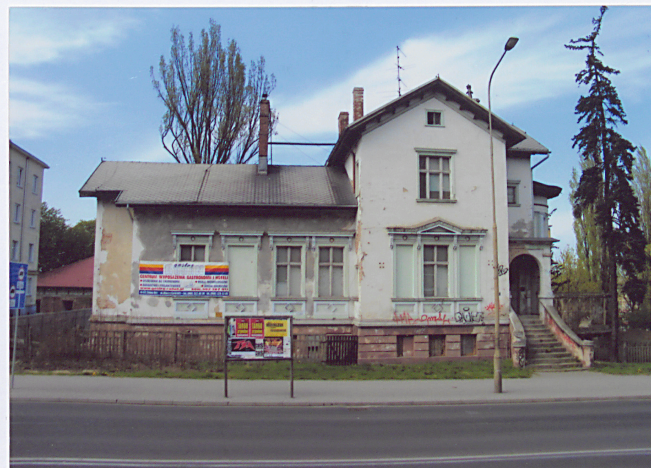
2. Elewacja frontowa, południowo – wschodnia.