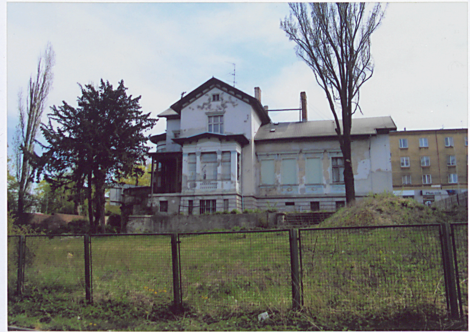
4. Elewacja tylna, północno – zachodnia.