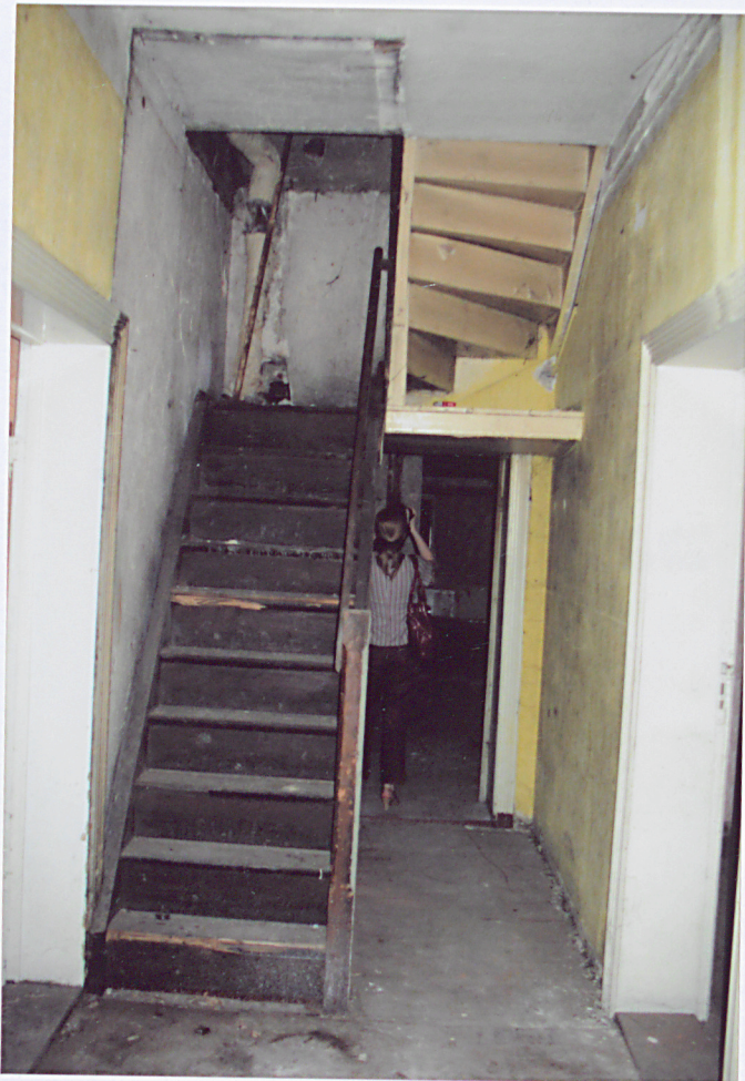
19. Schody na poddasze.