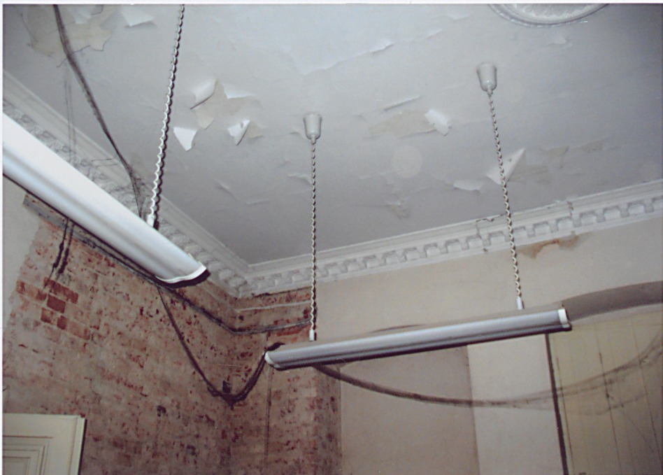
13. Sztukaterie na suficie w pokoju na parterze.