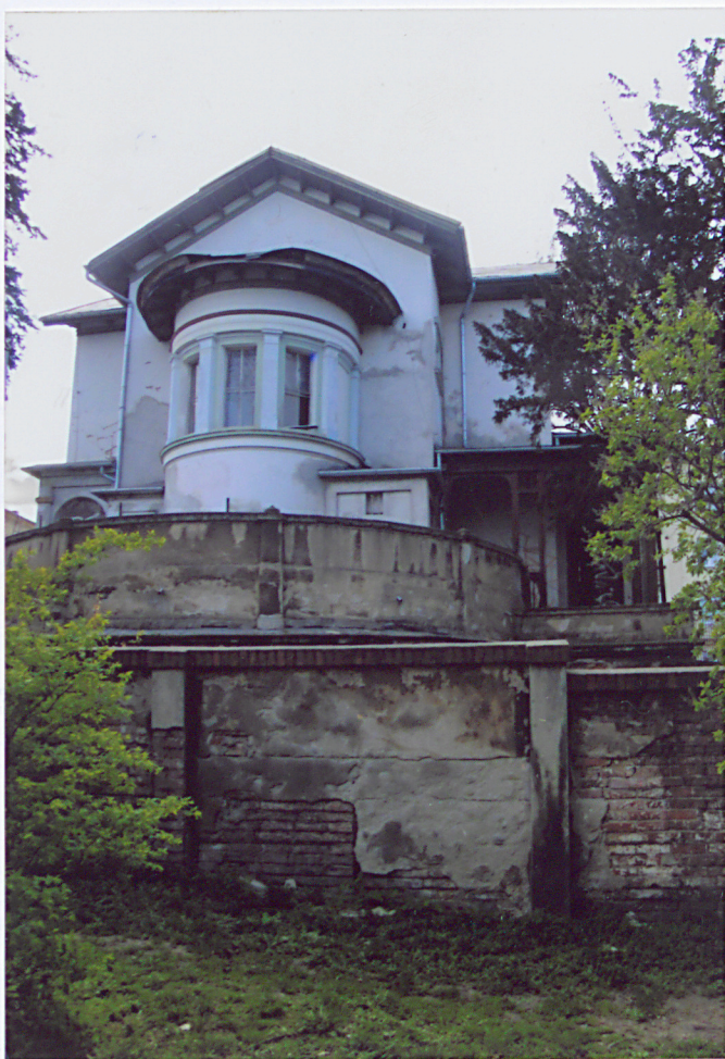
5. Elewacja boczna, północno – wschodnia.