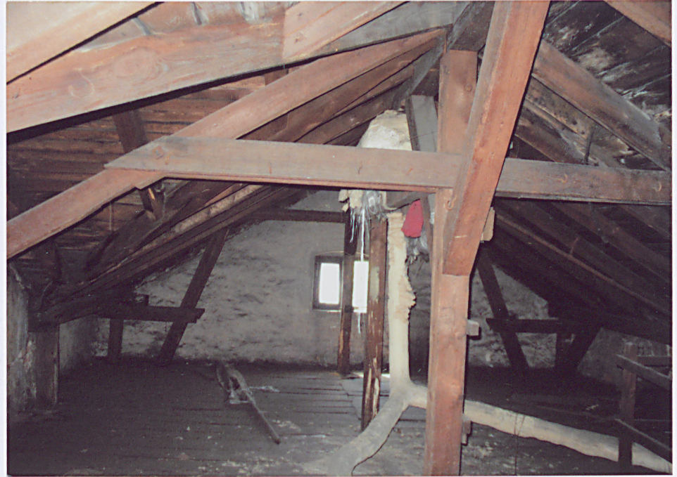
22. Więźba dachowa nad północno – wschodnią częścią budynku.