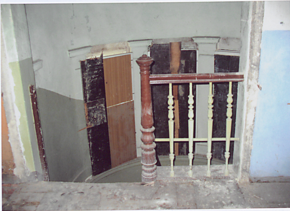
17. Klatka schodowa.