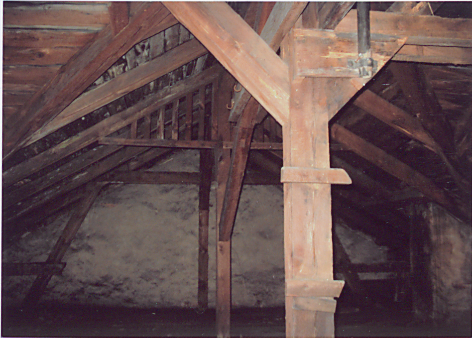
21. Więźba dachowa nad północno – wschodnią częścią budynku.