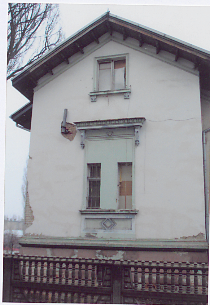
6. Elewacja boczna, południowo – zachodnia.