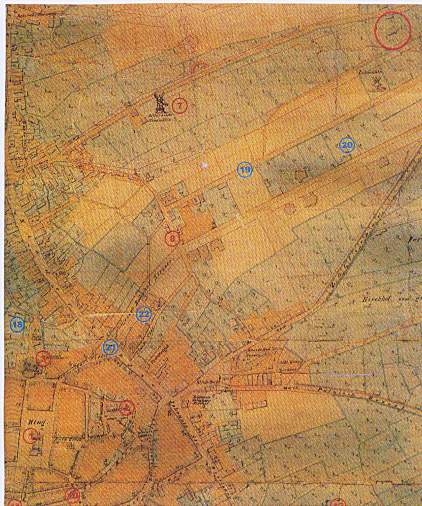
25. Fragment reprints planu Zielonej Góry z 1871 roku.