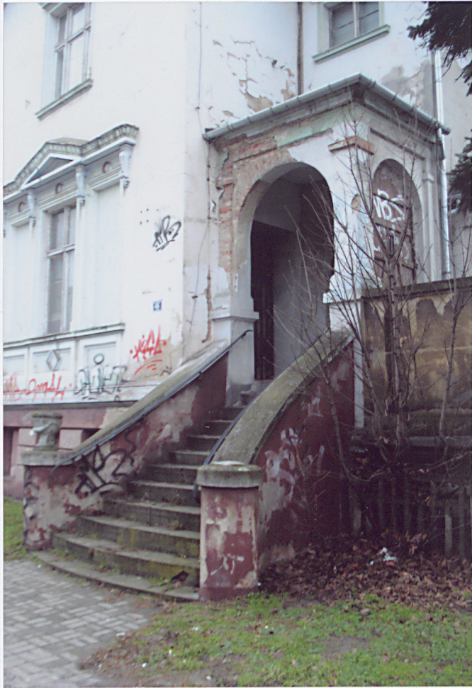
9. Ganek w skrzydle południowo – wschodnim.