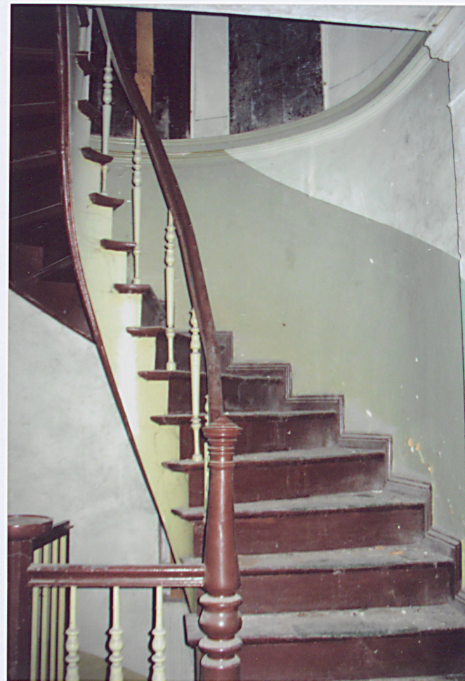
16. Schody na piętro.