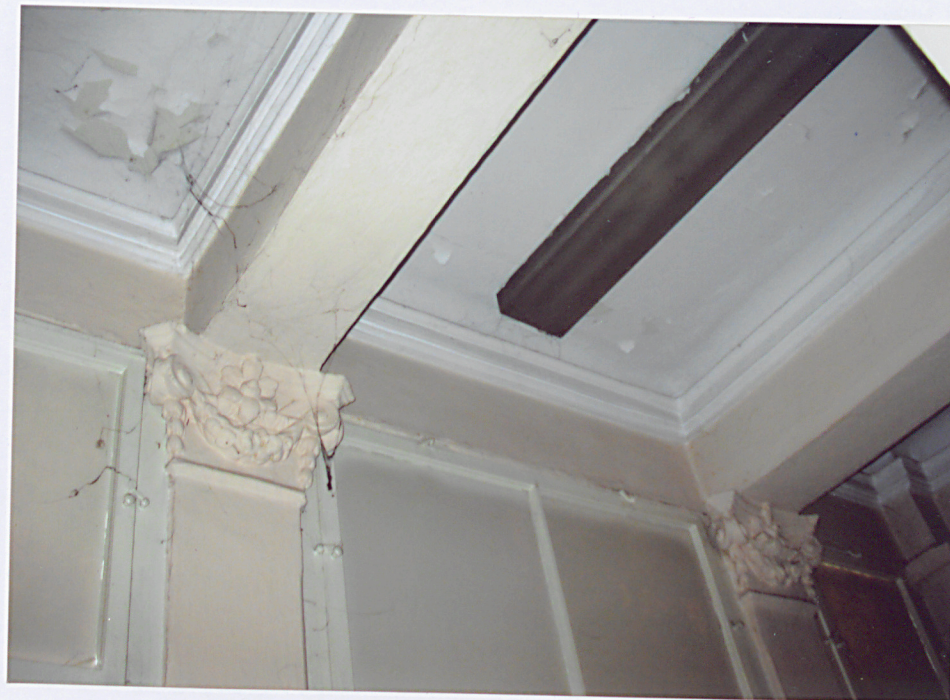
14. Wnętrze ganku przy skrzydle północno – zachodnim.