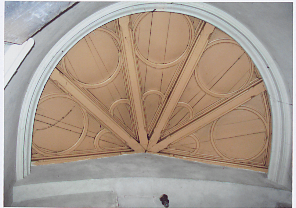
18. Sufit klatki schodowej.