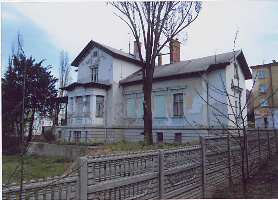
3. Widok od północnego zachodu.