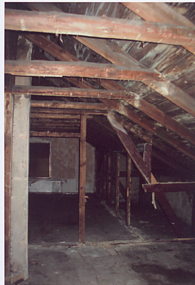
20. Wiązba dachowa nad południowo – zachodnią częścią budynku.