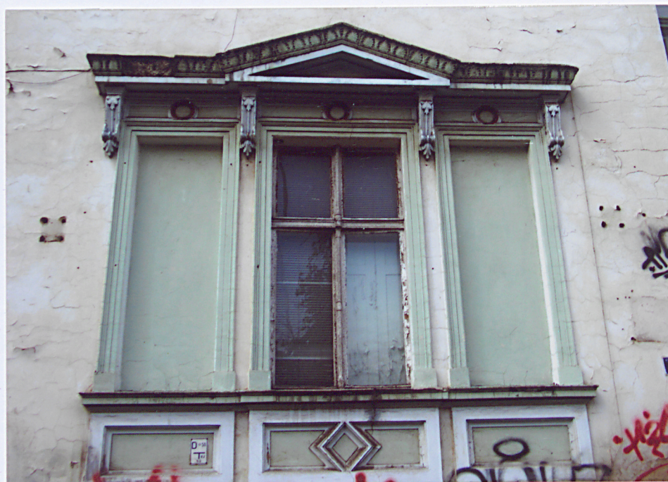
7. Okno na parterze skrzydła południowo – wschodniego.