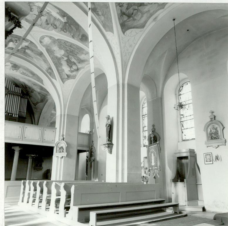
Fot.6. Wnętrze kościoła – widok z prezbiterium na wnętrze korpusu nawowego – trzy wysokie arkady łączące nawę środkową z nawą północną (wnętrze halowe).

Wkładkę założył: ..... Łucja Gajda, 1997 r. (imię, nazwisko, data)