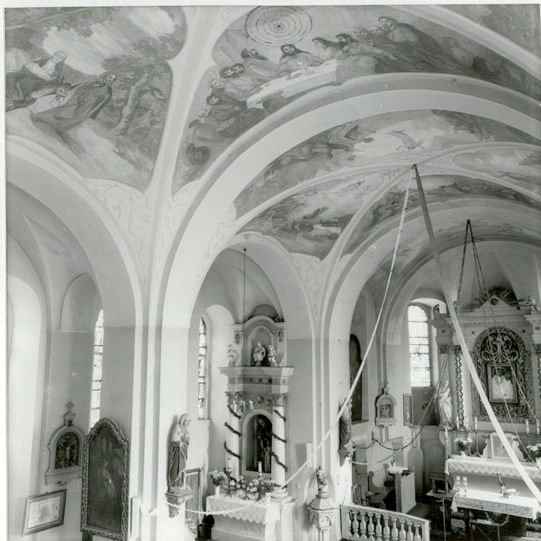
Fot.1. Widok ogólny wnętrza kościoła tj. z empory organowej w kierunku wschodniej ściany zamykającej północną nawę boczną.