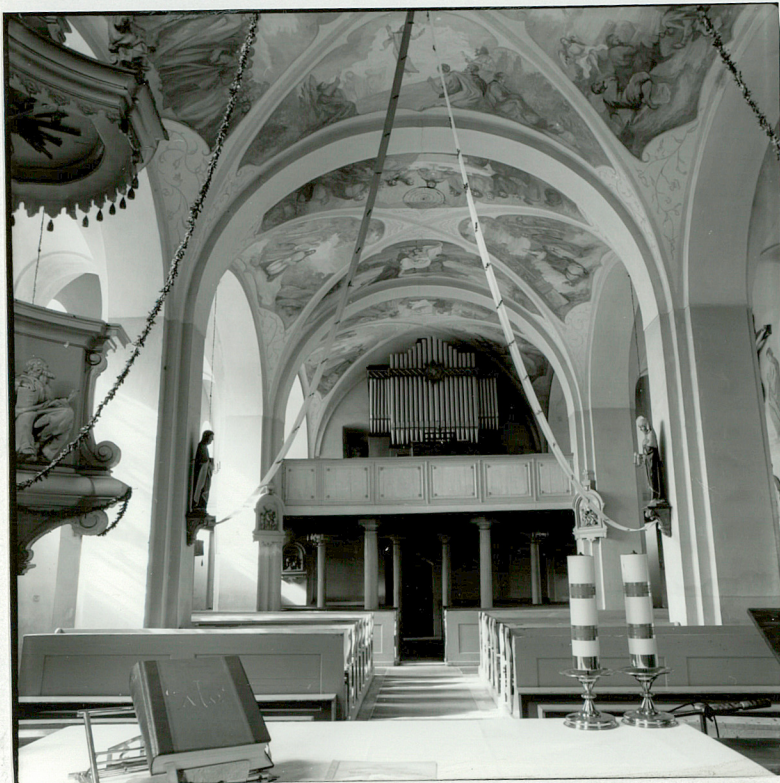
Fot.5. Wnętrze kościoła – widok ogólny z prezbiterium wzdłuż osi podłużnej na empore organową.