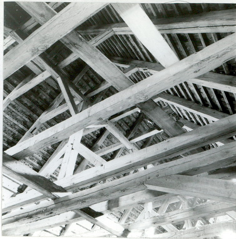
Fot.3. Widok ogólny więźby dachowej → górna kondygnacja więźby konstrukcji stolcowej, oparta na jednorzędowej ramie stolcowej; stolce stoją na jętkach dolnych, są z nimi usztywnione parą mieczy dolnych, górą podtrzymują podciąg pod jętkami górnymi, z którym również stolec usztywniony jest parą mieczy górnych.