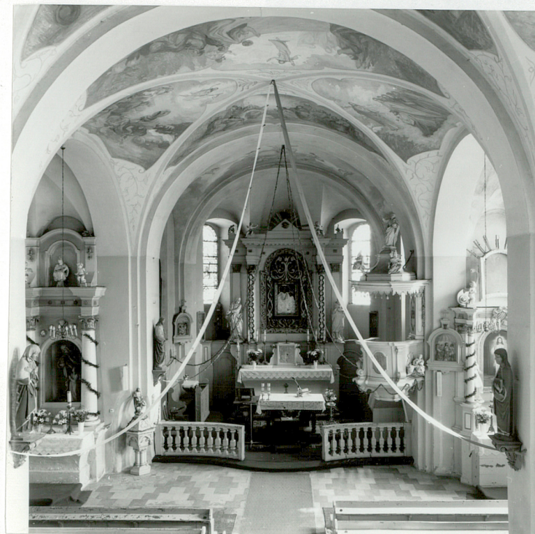
Fot.2. Widok ogólny wnętrza kościoła z empory organowej wzdłuż osi podłużnej kościoła w kierunku prezbiterium.

Wkładkę założył: ..... Łucja Gajda, 1997 r. (imię, nazwisko, data)