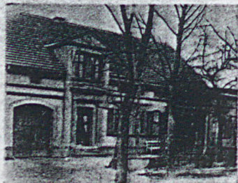
Postagentur Rob. Heibig