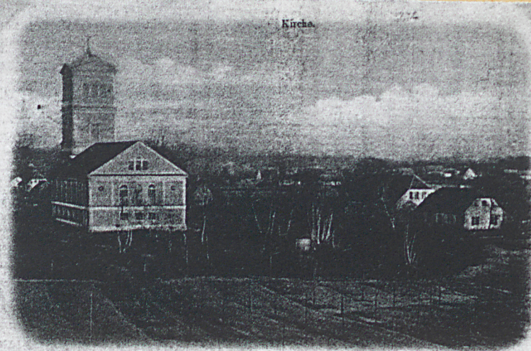
Gruss aus Trebschen (Friedrichshuld.)