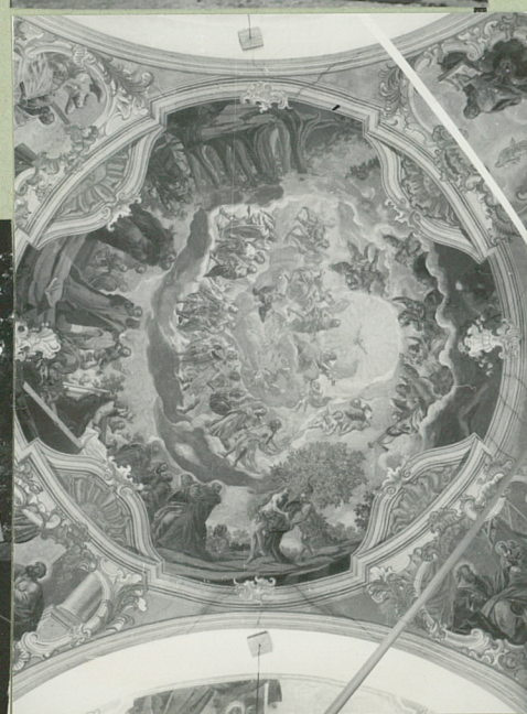
32. Przebieg prac konserwatorskich