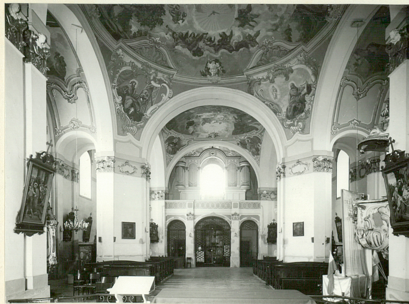
neg. nr 52552