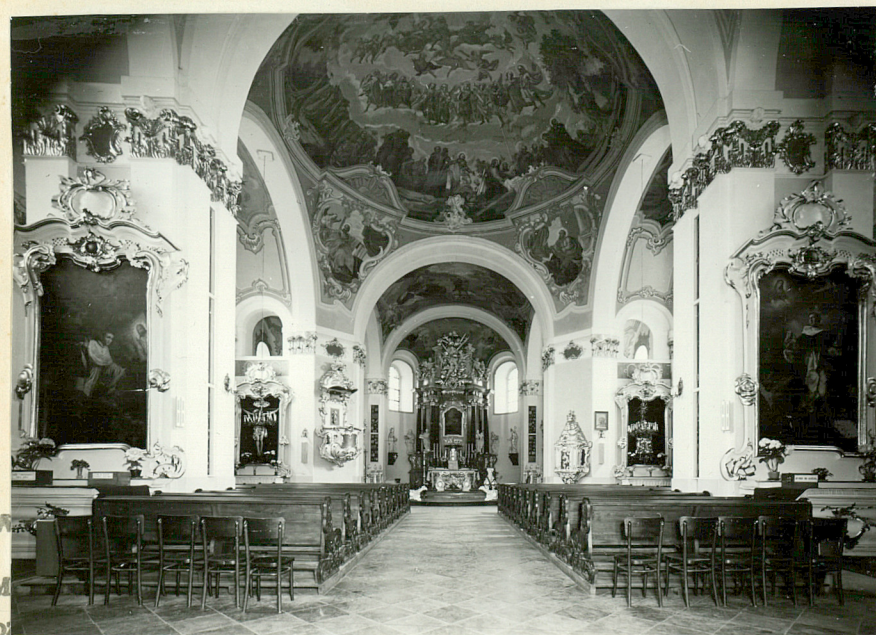
neg. nr 56584