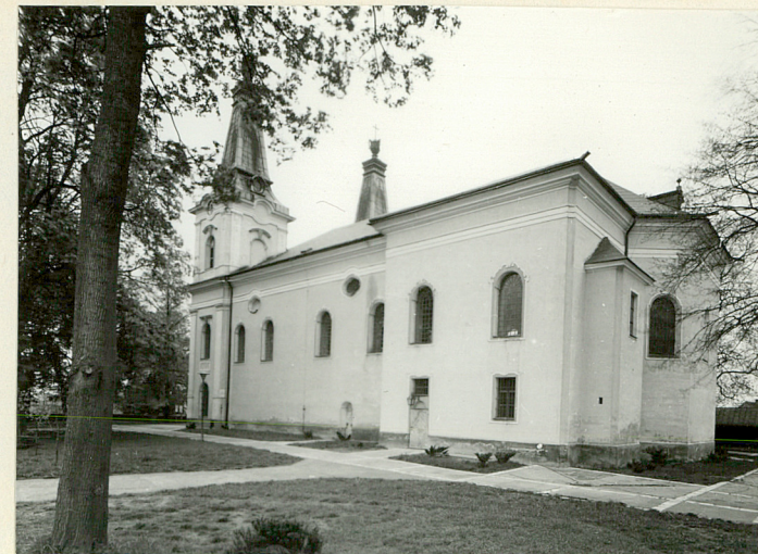
neg. nr 56581