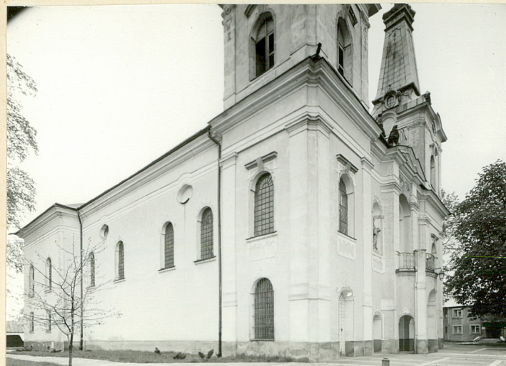
neg. nr 56582