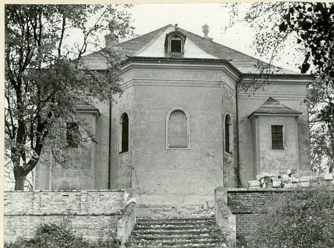
neg. nr 60499