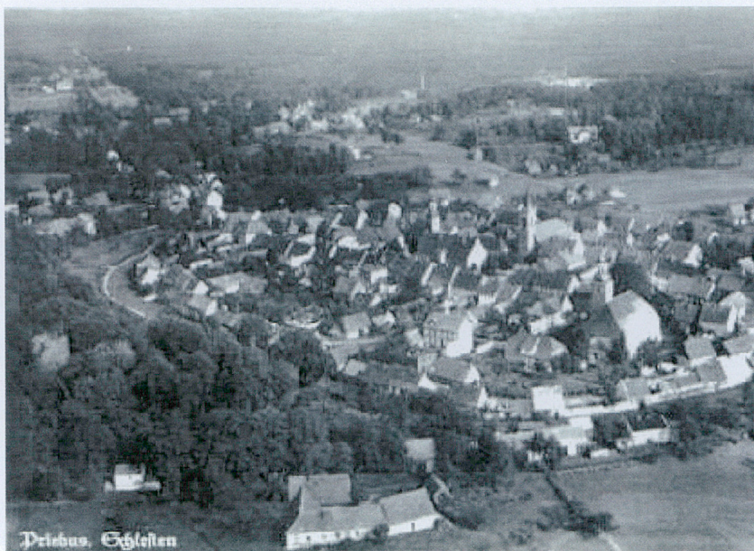
Panorama miasta z 20-tych lat XX w. – zdjęcie publ. na oficjalnej stronie miasta: www.przewoz.com.pl