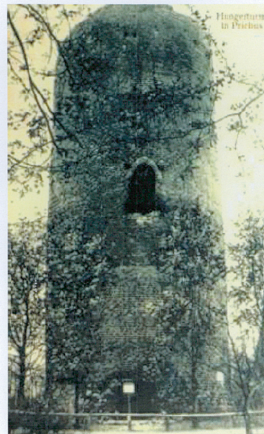
Wieża Głódowa, pocztówka z 1909 r., publ., www.przewoz.com.pl