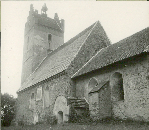
33. Koszty w tys. zł