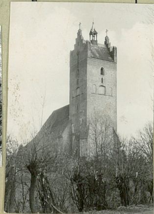
36. Wypełnił dnia