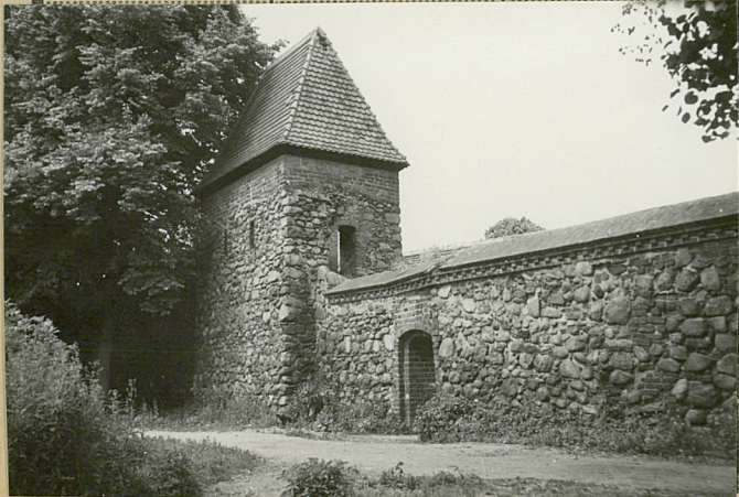
36. Wypełnił dnia