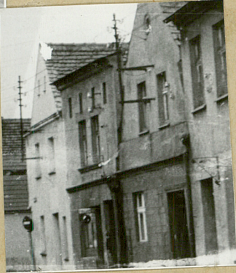
front z od lewej