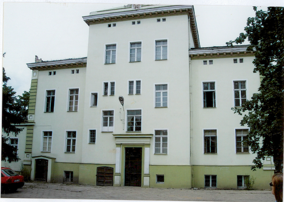
8. Zachodnia strona budynku