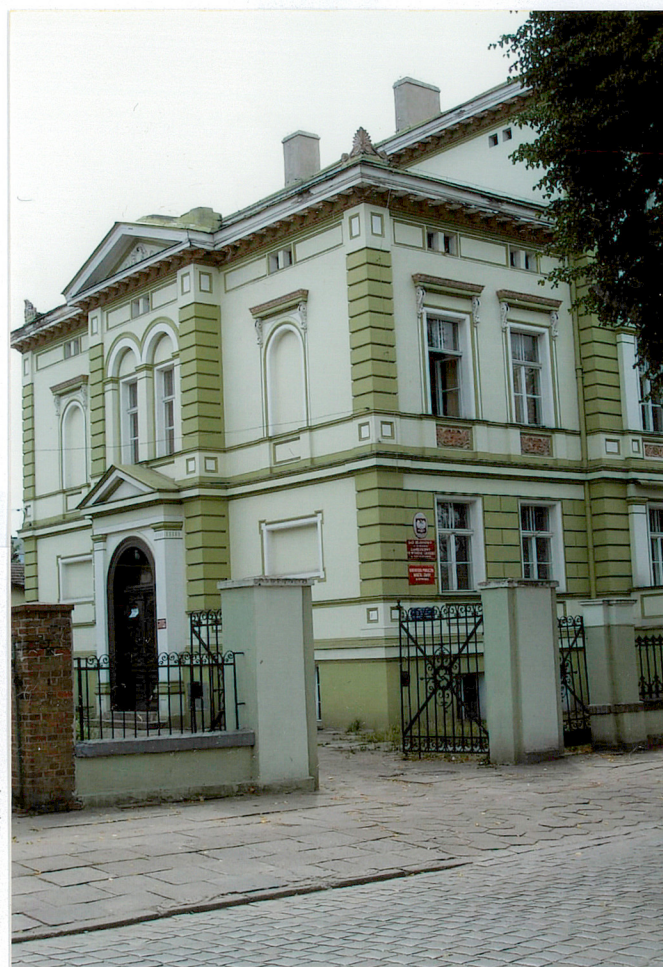
5. Fasada wschodnia budynku