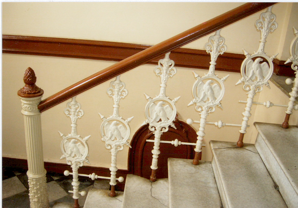
10. Balustrada schodów w westybuli.