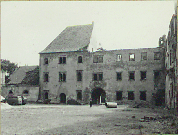
STAN PRZED 1945