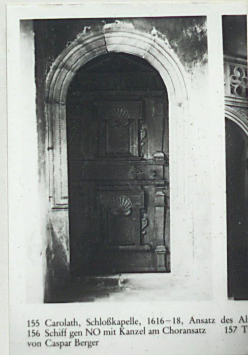
155 Carolath, Schloßkapelle, 1616–18, Ansatz des Altars 156 Schiff gen NO mit Kanzel am Choransatz 157 Tür von Caspar Berger