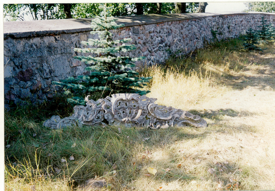
Obramowanie do tablicy nagrobnej i fragment rokokowej snycerki z wnętrza kaplicy.