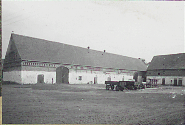
36. Wypełnił dnia XI.1965r.