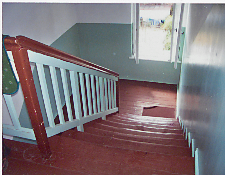
6. Klatka schodowa.