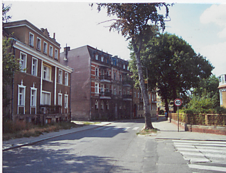
5. Widok ogólny.