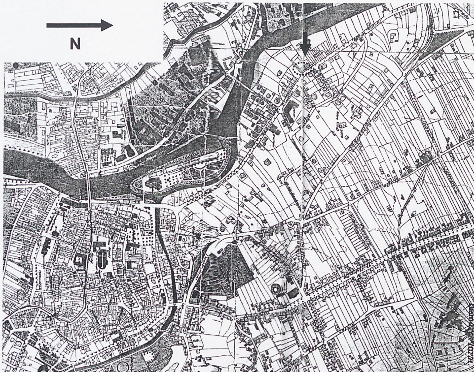
4. Mapa Gubina z 1929r.