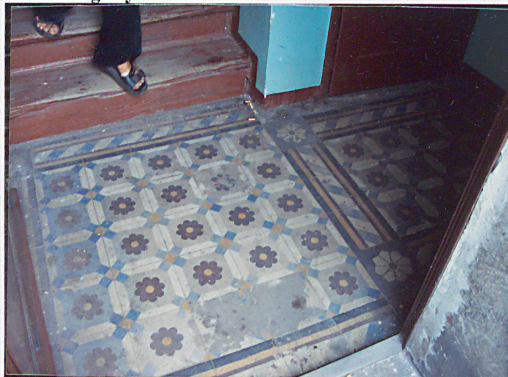
7. Posadzka przedsionka.