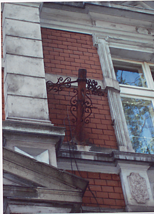
11. Detal elewacji frontowej.