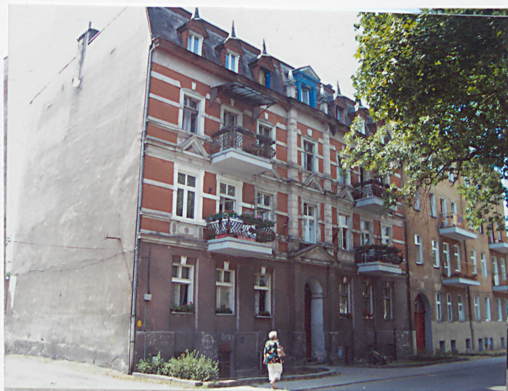
1. Elewacja frontowa - wschodnia.

zwieńczony jest trójkątnym naczółkiem. Okna siedmioosiowej elewacji mają zróżnicowaną oprawę - w pierwszej i trzeciej kondygnacji ujęte są płaskim obramieniem z klinćem, w kondygnacji drugiej oprawę wzbogaca trójkątny naczółek nad gzymssem. Okna poddasza zwieńczone są naczółkiem ze sterczyną. Pod oknami drugiej i trzeciej kondygnacji, w pionie drugiej i szóstej osi, występują balkony z ozdobnymi metalowymi balustradami w kształcie nawiązującym do baroku. Elewacja tylna (zachodnia) prosta, przepruta rzędami prostokątnych okien w siedmiu osiach. Na osi środkowej prostokątny otwór wejściowy i okna klatki schodowej osadzone niżej od pozostałych. Elewacja południowa ślepa. W kamienicy znajdują się mieszkania, o niewyróżniających się wnętrzach bez zabytkowego wwnoszenia.