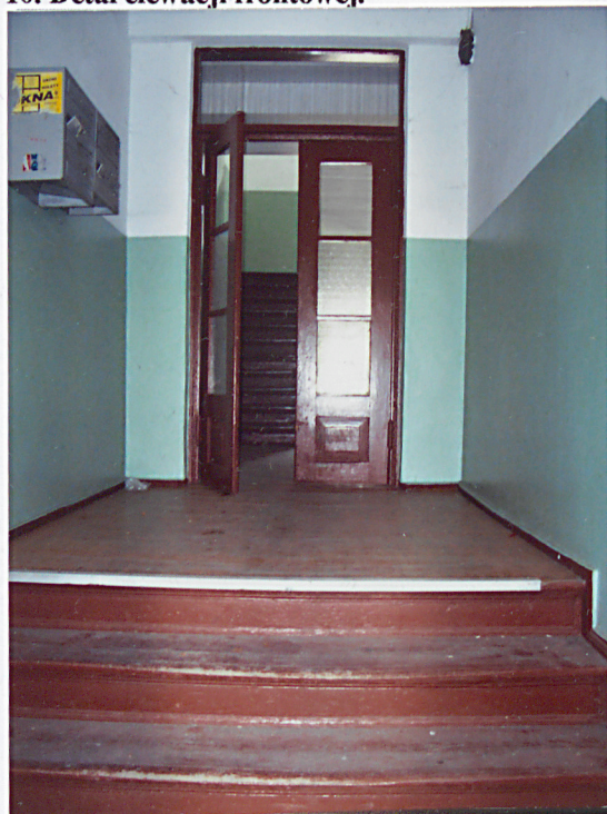
13. Drzwi przedsionka.