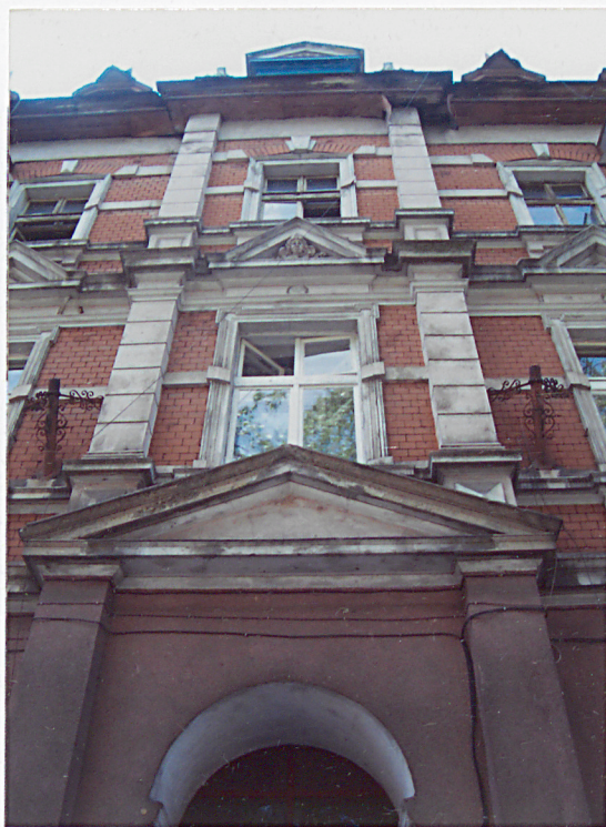
10. Detal elewacji frontowej.