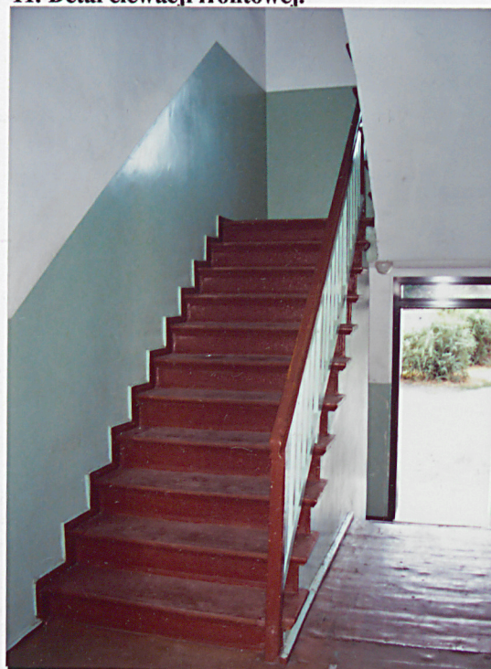
14. Główna klatka schodowa.