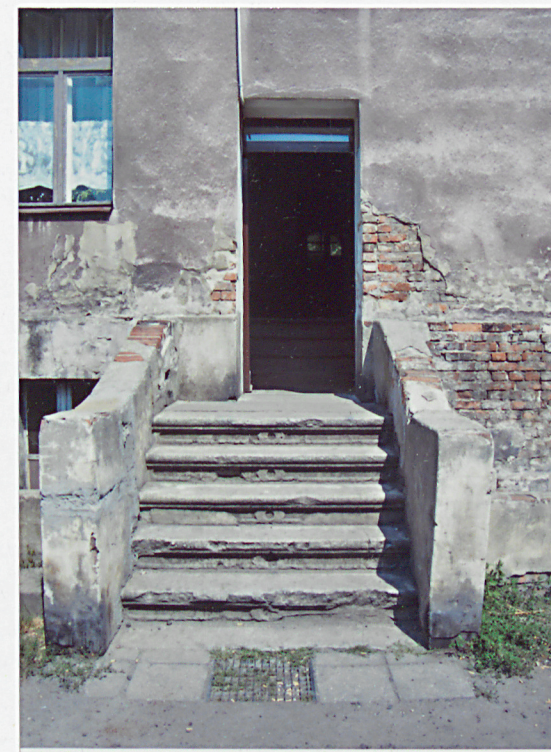
9. Wyjście na podwórze.