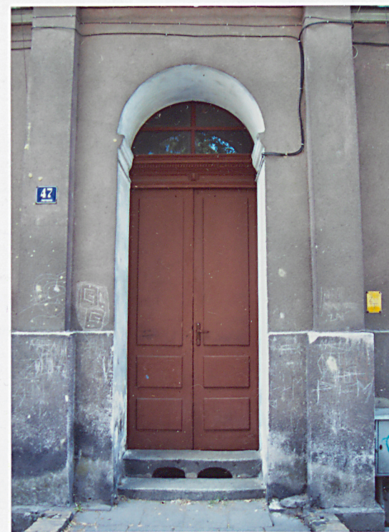
12. Drzwi frontowe.