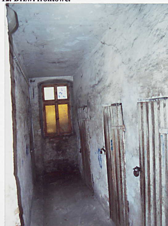
15. Korytarz piwnicy.