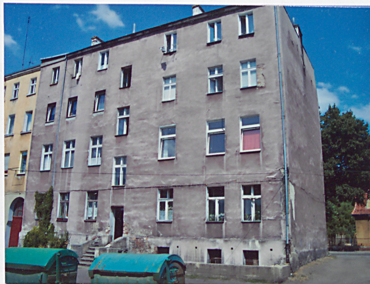
2. Elewacja tylna – zachodnia.