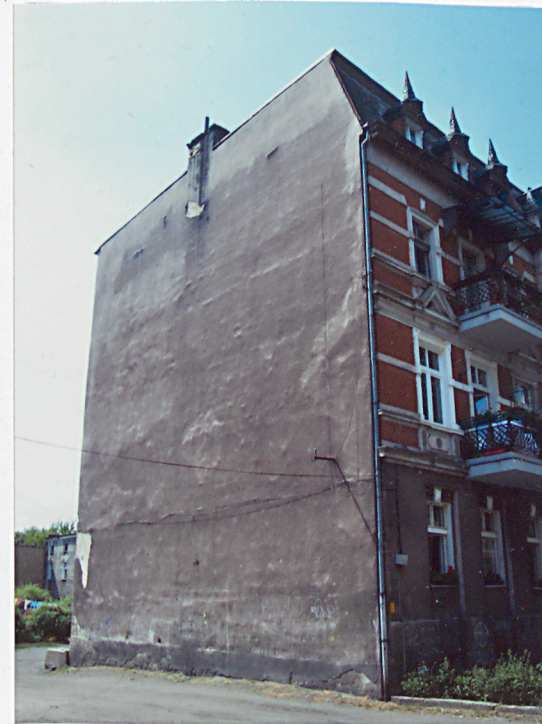
3. Elewacja południowa.