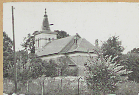
Elewacja wschodnia wysokość 6 m