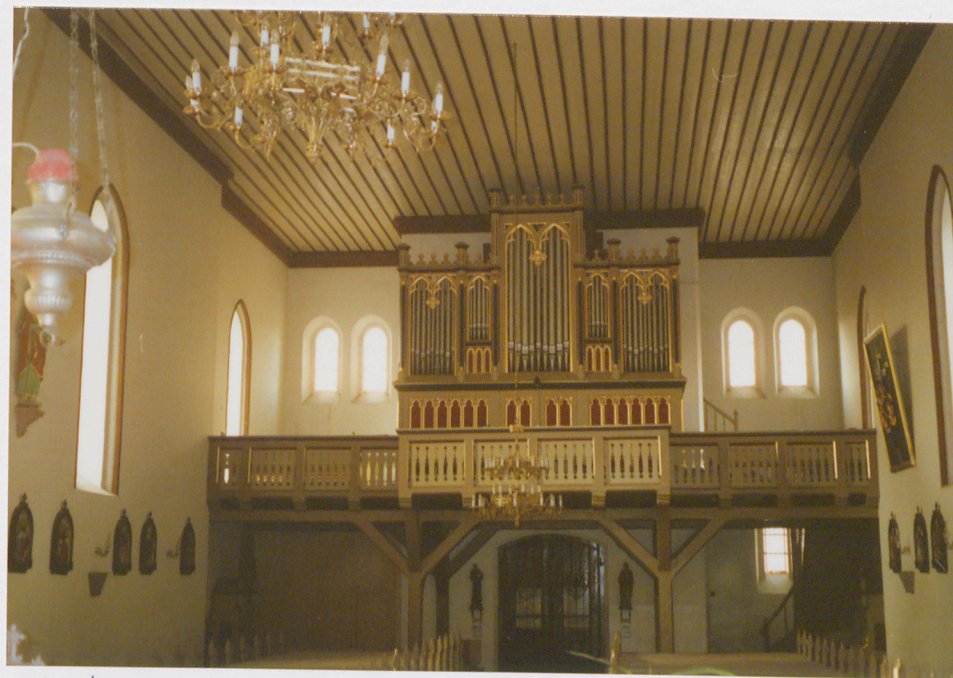
Wnętrze z widokiem na empore organową