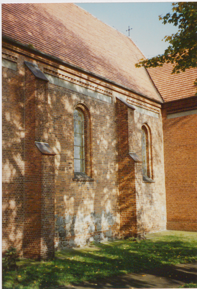
Fragment elewacji północnej