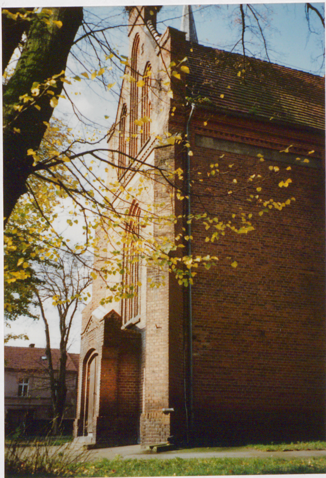
Widok na kaplicę przy elewacji płd.