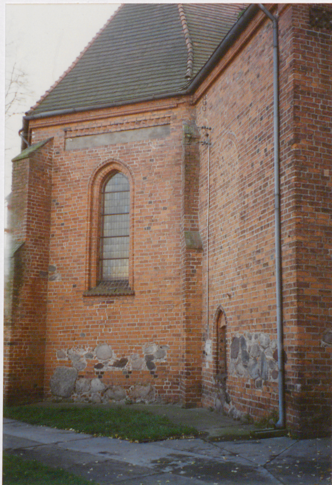
Widok na prezbiterium