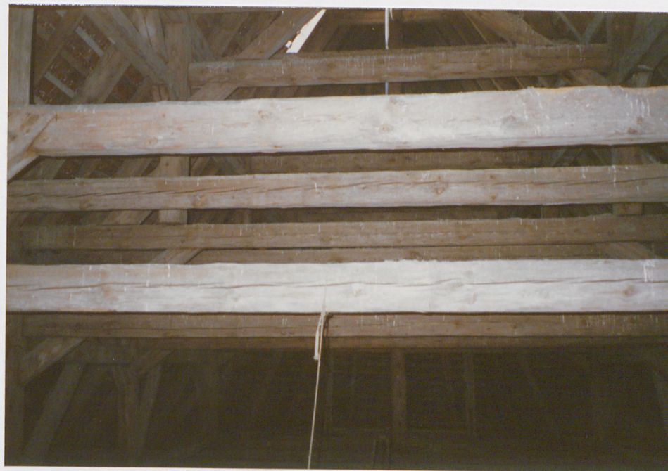
Widok na więźbę dachową