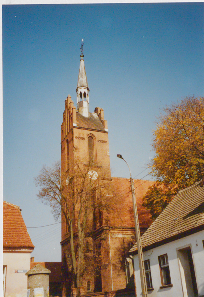
Widok na wieżę od str. połud.-zach.