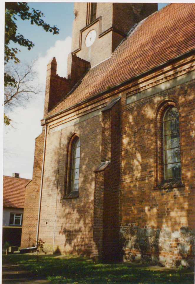
Fragment elewacji północnej