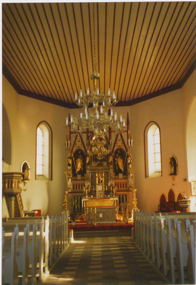
Wnętrze z widokiem na ołtarz główny