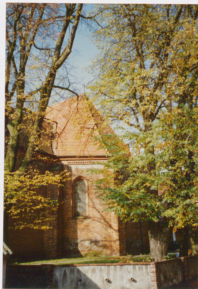
Widok na prezbiterium