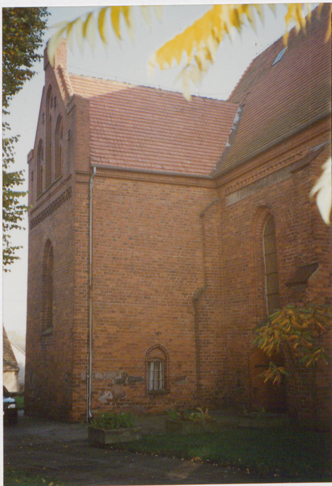
Widok na zakrystię